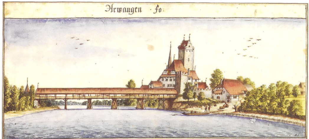
7 Aarwangen, Schloss. Aquarell von Albrecht Kauw, um 1676/1678. Am rechten Ende der Brücke ist deutlich der gezinnte Eckturm erkennbar. Blick nach Osten.

Der Palas dürfte 1373 oder wenig später errichtet worden sein. Mehrere Balken aus der Geschossbalkenlage des zweiten Obergeschosses weisen Schlagdaten vom Herbst/Winter 1372/73 auf. Damals war die Burg im Besitz der Herren von Grünenberg, die die Herrschaft 1341 von Ritter Johann, dem Letzten der Ministerialen von Aarwangen, geerbt hatten. In der älteren Literatur wurde vermutet, dass Petermann von Grünenberg, der damalige Herrschaftsinhaber, auf der Rothenburg im Kanton Luzern lebte und die Burg Aarwangen durch einen Amtmann verwalten liess. Ausserdem soll die Burg beim quellenmässig belegten Durchzug der Gugler 1375 niedergebrannt beziehungsweise zerstört worden sein. Beides ist mit dem Nachweis eines repräsentativen viergeschossigen Palas, der 1373 errichtet wurde, so nicht mehr haltbar. Brandspuren fehlen, und der Fund eines beinernen Spielsteins lässt vermuten, dass damals in der Burg adlige Alltagskultur gepflegt wurde (Abb. 8).