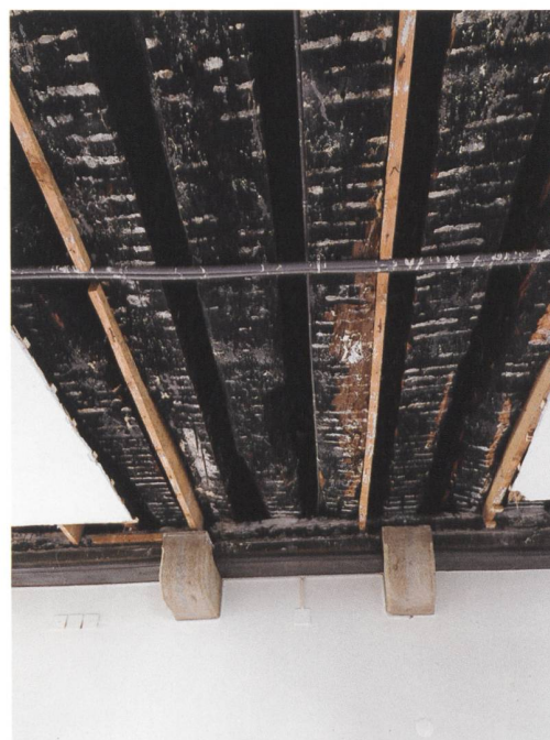
5 Aarwangen, Schloss. Enggestellte Bodenbalkenlage (Herbst/Winter 1372/73d) des mutmasslichen Obergadens. Blick nach Süden.

Erdgeschosses und der unteren Hälfte des ersten Obergeschosses, gibt es jedoch keinen Eckverband; dort zieht die Mauer weiter nach Süden – wohl als Ringmauer. Die gleiche Disposition besteht östlich des Turms, wo einerseits die an den Turm stossende Palassüdmauer erhalten