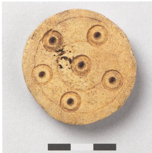
8 Aarwangen, Schloss. Bei Ausgrabungen im Palas kam dieser beinerne Spielstein zum Vorschein. Schach, Mühle und Tric-Trac (Backgammon) waren im 14. Jahrhundert ein häufiger Zeitvertreib adliger Burgbewohnerinnen und -bewohner.

1775 wurde die Pfisterei im Nordosten der Anlage auf ihr heutiges Volumen erweitert und mit dem noch bestehenden Mansarddach gedeckt. Damals wurde das südseitige Fachwerkgebäude abgebrochen und durch ein gemauertes Ofenhaus mit etwas anderem Grundriss ersetzt.