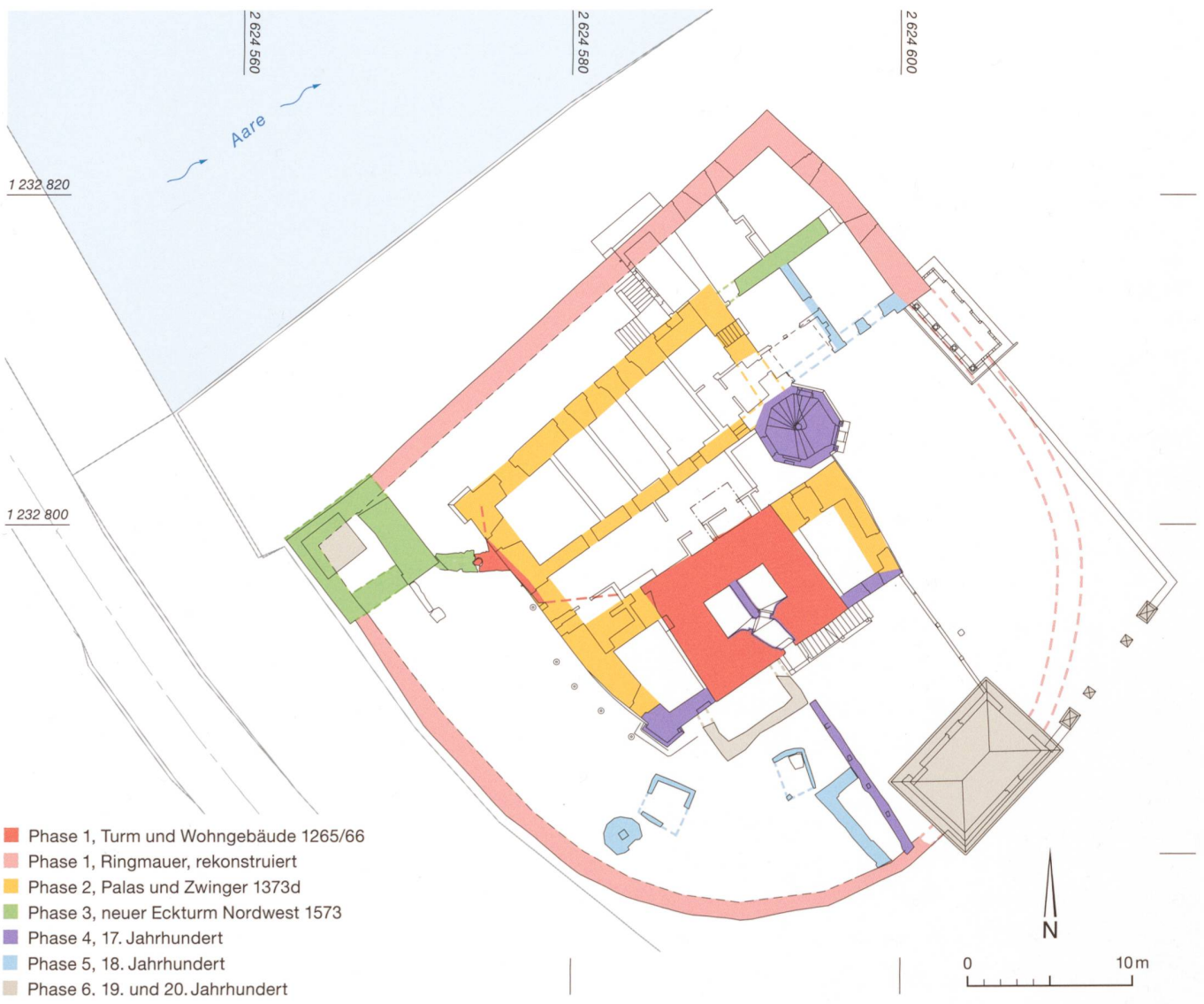
3 Aarwangen, Schloss. Grundriss auf dem Erdgeschossniveau mit den verschiedenen Bauphasen. M. 1:400.

Die heutige Binnenwand des Palas, die in jedem Geschoss den südseitigen Korridor von einem grösseren Raum abtrennt, ist relativ chronologisch jünger, gehört aber höchstwahrscheinlich auch zu Phase 2 (orange) (Abb. 3). Wegen der grossen Gebäudebreite ist eine Längsunterteilung des Grundrisses zu erwarten. Der Nordteil des Palas ist heute bis auf die Flucht der genannten Binnenwand unterkellert. Wahrscheinlich gehört auch der heute mit einem Tonnengewölbe schliessende Keller zur Phase 2, er ist aber bisher nicht bauarchäologisch untersucht worden (Abb. 2).