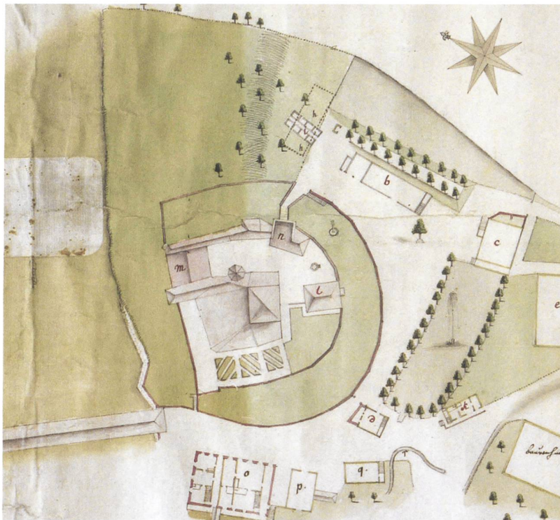
6 Aarwangen Schloss. Plan von 1755 (Ausschnitt). Osten ist oben und die Aare ist links. Staatsarchiv Bern, AA IV Aarwangen 1.

ist, aber ebenso ein mit dieser im Verband stehendes Mauerstück, das nach Süden zieht. Es ist deshalb zu vermuten, dass diese beiden nach Süden ziehenden Mauern ursprünglich südlich des Turms einen Hof oder Zwinger bildeten. Zwar fanden sich bei den Untersuchungen im Untergrund in diesem Bereich keine Spuren. Da aber das Mauerwerk dieser Phase 2 nur wenig fundiert ist und jüngere Baumassnahmen in diesem Bereich tief eingegriffen haben, ist es wahrscheinlich, dass diese älteres Mauerwerk zum Verschwinden gebracht haben.