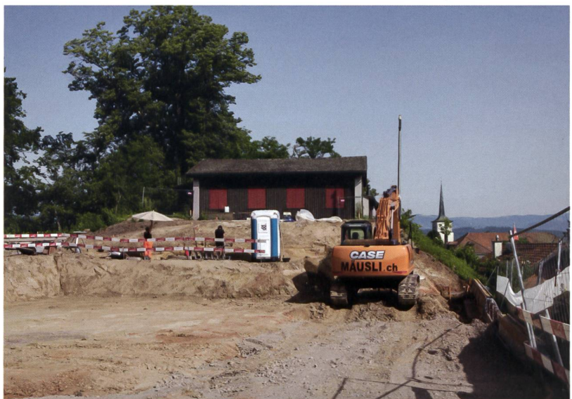
4 Lyss, Hutti 27. Grabungssituation am Südrand des Kirchhubels. Rechts ist der Kirchturm der neuen reformierten Kirche von Lyss zu sehen. Blick nach Norden.

Unterschiede bei der Grabkonstruktion zeigten sich in der Grösse und Form der Grabgruben, in der Wahl der verwendeten Materialien für die Einfassung sowie in der Lage der Skelette. In den Gräbern Pos. 4 und 60 lagen einzelne Steine, die mehr oder weniger eine Linie bildeten. Die drei Gräber Pos. 4, 40 und 60, mit Wandverputzstücken in der Verfüllung, hatten