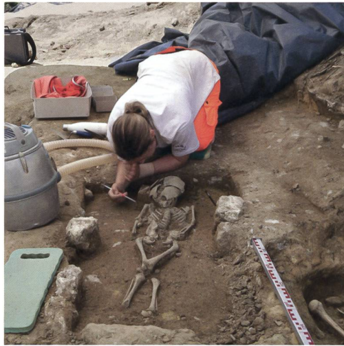
3 Lyss, Hutti 27. Eine Mitarbeiterin des Archäologischen Dienstes beim Freilegen des Kindergrabes Pos. 4. Auf der Grabsohle wie auch in der Hinterfüllung der Grabgrube wurden römische Wandverputzfragmente (weissgraue Einschlüsse) geborgen.

Die meisten geosteten Bestattungen lagen nicht genau in der erwähnten Himmelsrichtung, sondern mit dem Blick nach Nordos-