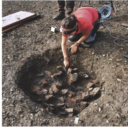
2 Münsingen, Entlastungsstrasse Nord. Eine Grube (Pos. 2374) mit verbrannten Hölzern und viel spätbronzezeitlicher Keramik wird ausgegraben. Blick nach Nordwesten.

Unter den römischen Mauern und Böden im Nordteil der Grabungsfläche erhielten sich zwei rund 2,5 m grosse Gruben aus der Hallstattzeit (8.–5. Jh. v. Chr.). In einer zeigten sich Hinweise auf einen rechteckigen Holzeinbau, möglicherweise diente diese Grube der Vorratshaltung. Zu einem späteren Zeitpunkt wurde auf der Nordseite der Einbau herausgerissen, ein durch Hitzeeinwirkung mürbe gewordener Gneis (1,2 × 0,5 × 0,3 m) in die Grube hineingeworfen und daneben ein aufwendig verziertes Gefäss deponiert. In der anschliessenden Auffüllung der Grube fand sich neben Keramikscherven auch eine Paukenfibel (6. Jh. v. Chr.). Das Fehlen von menschlichen Knochen macht eine Interpretation der Grube als Grab unwahrscheinlich.