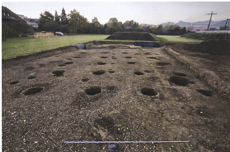
6 Münsingen, Entlastungsstrasse Nord. Auffällig grosse Pfostengruben in mehreren Reihen. Sie gehören zu einem vermutlich römischen Holzgebäude. Blick nach Süden.

Sohle liegender grossfragmentierter Keramikscherben ebenfalls in die späte Latènezeit zu datieren. Dies bestätigt eine Radiokarbondatierung. Der nördliche Graben (Pos. 624) war lediglich 1,2 m breit und lieferte kaum Funde aus den unteren Auffüllungen, die jüngste enthielt bereits römische Dachziegel. Aufgrund seiner Lage und Orientierung dürfte er in der Spätlatènezeit ausgehoben worden sein. Holzkohleproben aus den Auffüllungen werden eine genauere Datierung erlauben.