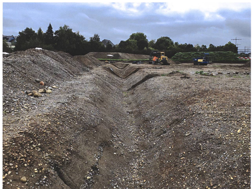
3 Münsingen, Entlastungsstrasse Nord. Der grosse spätlatènezeitliche Graben (Pos. 337) in geleertem Zustand. Blick nach Süden.

Von besonderem Interesse sind mehrere Gräben, die sich über das südliche Grabungsareal erstreckten. Ein Nord-Süd-verlaufender Spitzgraben (Pos. 337; Abb. 3 und 4) konnte