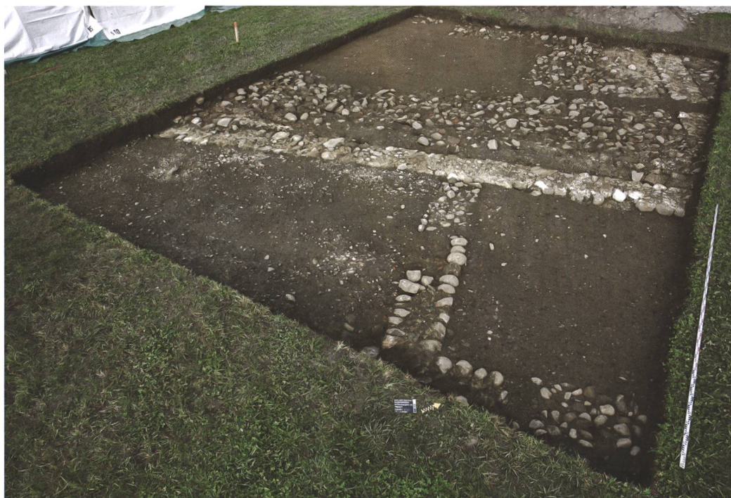
7 Münsingen, Entlastungsstrasse Nord. Direkt unter dem modernen Pflughorizont liegende Fundamente des römischen Steinbaus. Im Vordergrund zwei kleine, südseitige Räume, im Hintergrund der Südostteil des grossen Raums, verfüllt mit Abbruchschutt. Blick nach Nordwesten.

Erst zu Beginn der frühen Kaiserzeit wurde der spätlatènezeitliche grosse, Nord-Süd-orientierte Graben (Pos. 337) aufgefüllt und ausgeebnet. Quer darüber wurde eine Strasse angelegt. In einer ersten Phase bestand sie lediglich aus einer Kiesschicht, in einer zweiten Phase wurde eine Rollierung aus grossen Steinen mit einem Kieskoffer versehen. Dass die Strasse im Bereich des Grabens überhaupt erhalten ist, verdankt sie dem Umstand, dass sich die weichen und teilweise organischen Grabenfüllungen über die Jahrhunderte abgesenkt hatten. Östlich und westlich des Grabens hat die moderne Landwirtschaft ihre Spuren zerstört. Ein vorläufig nicht genauer datierter Bau, von dem sich nur das Steinfundament erhalten hatte ( 2,4 \times 2,8 m; 6,7 m 2 ), lag westlich des erhaltenen Strassenabschnitts und dürfte an der Südseite der an dieser Stelle weggepflügten Strasse gelegen haben. Unmittelbar südlich davon wurden im 3./4. Jahrhundert zwei Pferde bestattet, eines in einer Grube und eines in einer flachen Mulde. Es ist möglich, dass es sich beim quadratischen Fundament um den Unterbau für ein Grabmonument oder allenfalls für eine kleine Kapelle handelt.