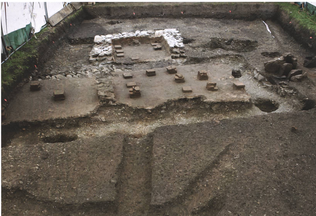
8 Münsingen, Entlastungsstrasse Nord. Die hypokaustierten Räume des Badetrakts mit südlich angebautem Warmwasserbecken. Die Hypokaustpfeiler waren dort enger gesetzt, um das Gewicht des Wassers zu tragen. Rechts die Einföhrung (Präfurnium) der Bodenheizung. Blick nach Süden.

Im 2020/21 untersuchten Steingebäude deuten Reste eines kaum 0,2 m breiten, aus Bruchsteinen trocken gesetzten Mäuerchens, wohl ein Balkenlager, auf eine nachträgliche Unterteilung des grössten Raumes. Das Gebäude