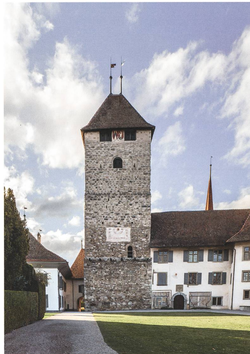
Abb. 5: Spiez, Schloss. Die hofseitige Fassade (Ostfassade) des Turms im Frühling 2019. Zu berücksichtigen ist, dass die untersten 4 m des Turmes nicht sichtbar sind, weil sie in einer Grabenaufschüttung stecken. Blick nach Nordwesten.

Markus Leibundgut und Matthias Bolliger. Spiez, Schloss, Turm. Dendrochronologischer Untersuchungsbericht 2019. Archäologischer Dienst des Kantons Bern. Gemeindefacharchiv, FP-Nr. 339.009.2019.01.