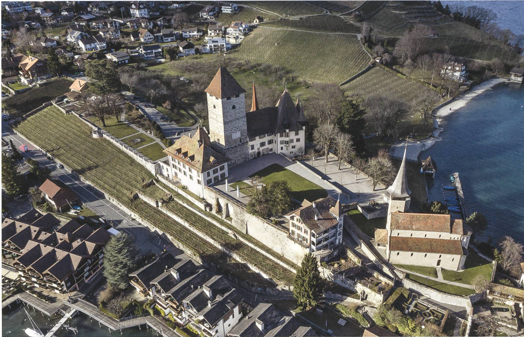
Abb. 4: Spiez, Schloss. Schloss und Schlosskirche im Frühling 2019. Blick nach Nordwesten.

Allerdings scheint es ungewiss, ob er tatsächlich fertig ausgebaut und – vor allem in den oberen Geschossen – bewohnt wurde oder ob er nicht im Rohbau verblieb.