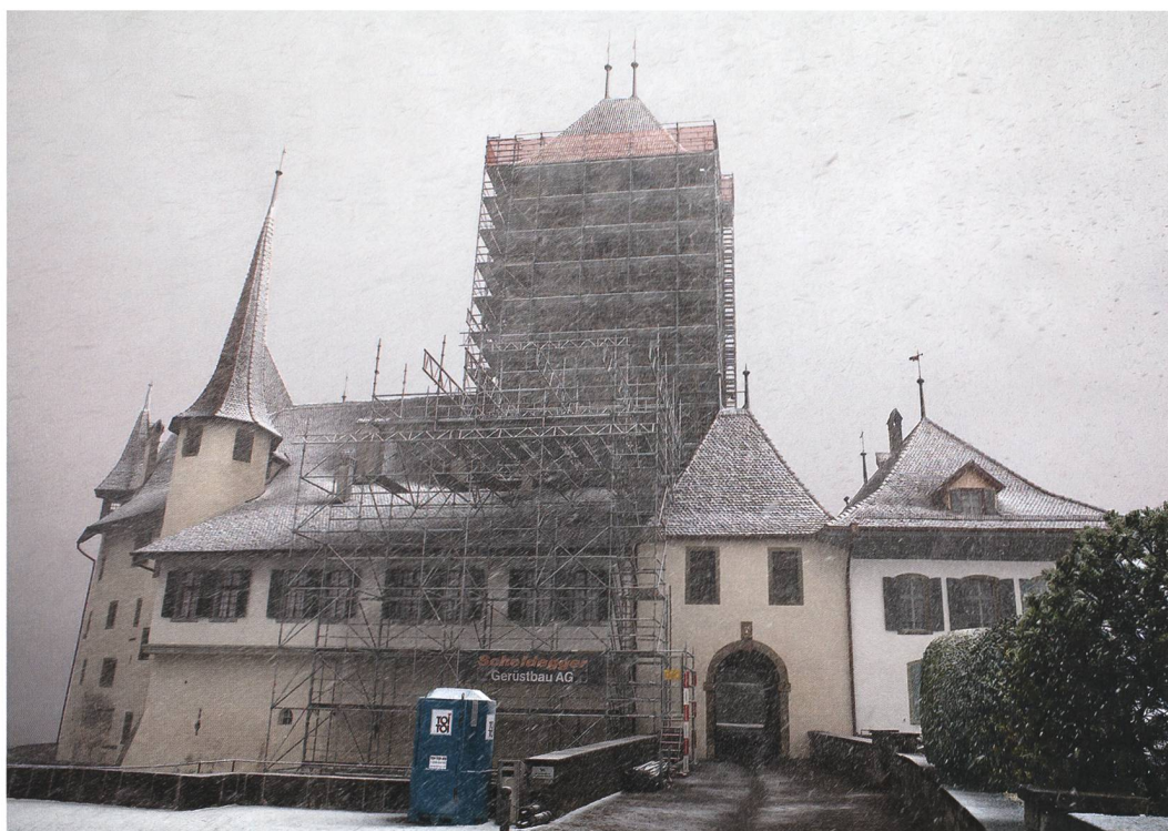
Abb. 1: Spiez, Schloss. Der eingerüstete Turm im Schneegestöber im Winter 2018/19. Blick nach Osten.

Die Mauerstärke beträgt im Sockelbereich ungefähr 3 m und verjüngt sich bis zur Wehrplatte auf 1 m (Abb. 3). Die Zinnen sind auf drei Seiten 0,9 m stark, auf der vierten im Osten wegen des im Mauerwerk integrierten Kamins 1,30 m.