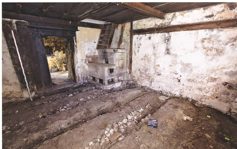
Fig. 4 : Petit-Val, Souboz, Haut du Village 37. Séjour. Négatifs de solives, fourneau en molasse de 1904 et escalier accédant à la pièce de nuit. À droite, on devine les maigres vestiges de lambris encore conservés.