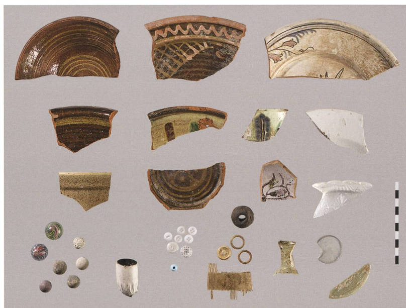
Fig. 8 : Petit-Val, Souboz, Haut du Village 37. Aperçu du mobilier archéologique mis au jour : vaisselle en terre, lot de billes, pipe en terre, boutons et verrerie reflétant trois siècles d'occupation.

La maison paysanne du Haut du Village 37 n'a subi que peu de transformations et sa structure d'origine est bien conservée. Le logement s'articulait autour d'une grande cuisine voûtée en position centrale. Le séjour, dont les murs étaient couverts d'un lambris finement ouvragé, disposait d'un poêle qui fut remplacé en 1904. Deux pièces situées à l'étage et remaniées au 19 e siècle complétaient le logis. Cette ferme reprend le modèle largement diffusé des fermes à poteaux verticaux, en vogue jusqu'à la fin du 18 e siècle dans le Jura. Toutefois, elle se distingue par une curiosité architecturale : un entrain traversant, assemblé à mi-bois aux poteau repose sur le couronnement du mur, tandis que les extrémités inférieures desdits poteaux dépassent et sont intégrés au corps de maçonnerie.