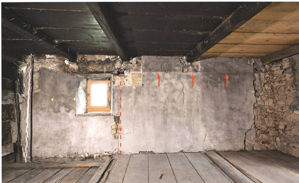
Fig. 7 : Petit-Val, Souboz, Haut du Village 37. Chambre nord. On remarque sur le mur nord, juste à droite de la fenêtre, la trace d'une cloison disparue (tireté) et surtout un rehaussement du plafond (daté vers 1820/25) marqué par un rhabillage de l'enduit (flèches).

de la vaisselle culinaire provenant de Bonfol, quelques fragments de pipes en terre, mais aussi de la vaisselle en verre, de menus objets en os et en verre, ainsi que de nombreuses billes en matériaux divers (fig. 8). Du verre à vitre a aussi été mis au jour, notamment des fragments de cives. Quoique fabriquées en masse dans les verreries toutes proches de Court, leur attestation en contexte de fouille restait plutôt rare dans la région jurassienne. Par ailleurs, de nombreuses chutes de cuir épais et des fragments de sangles découverts dans la cave paraissent témoigner d'une activité de sellier ou bourrellier, peut-être au début du 20 e siècle.