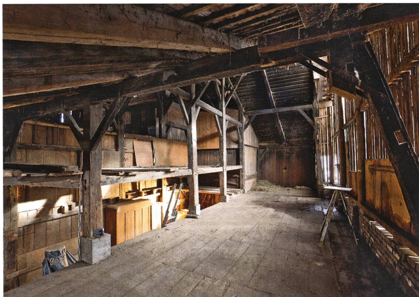
Fig. 3 : Valbirse, Bévillard, Les Vannes 15. Dans la grange, on remarque la solide charpente sur poteaux et, à droite, le voligeage formée de perches en rangs serrés qui autrefois portait la couverture de bardeaux. Vue vers le sud-est.

Les poteaux de chaque rangée étaient reliés entre eux par de faux-entraits contreventés; ils portaient d'épaisses pannes renforcées par des jambes de force. À l'origine, le toit était couvert de bardeaux cloués sur des rangs serrés de perches fixées directement aux chevrons. Ces derniers étaient disposés tous les deux mètres environ et conservaient encore, sur le pan sud, ce voligeage de perches (fig. 3). L'ensemble de la charpente originelle était noirci par la fumée qui s'échappait de l'âtre de la cuisine. Le devant-huis suggère que la façade et l'entrée principales se trouvaient déjà au sud.