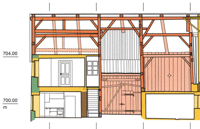
Fig. 6 : Valbirse, Bévillard, Les Vannes 15. Coupe longitudinale, vue vers le sud-est. Éch. 1:200.