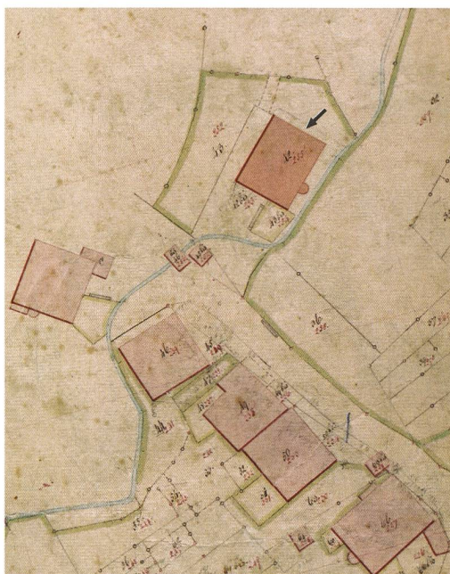
Fig. 1 : La plupart des bâtiments ruraux visibles sur cet extrait de plan cadastral levé en 1841 ont aujourd'hui disparu. La flèche pointe le bâtiment étudié. Éch. environ 1:1500.

Le bâtiment primitif (phase 1) fut édifié en bois pour l'essentiel; la travée orientale abritant l'habitation fut probablement construite en pan de bois hourdé de pierre. Les bois de