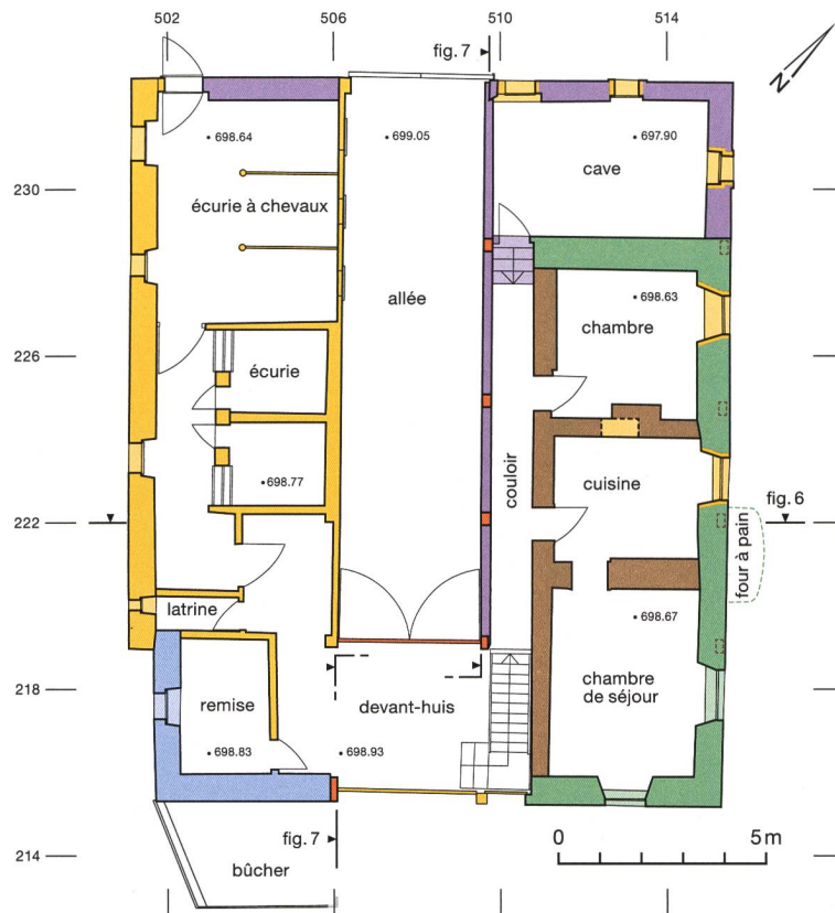
Fig. 5 : Valbirse, Bévillard, Les Vannes 15. Plan de masse du rez-de-chaussée. Éch. 1:200