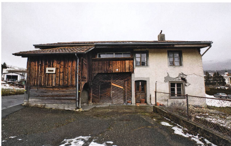
Fig. 2 : Valbirse, Bévillard, Les Vannes 15. Façade sud du bâtiment avant sa démolition.

l'ossature originelle furent abattus durant l'hiver 1764/1765, comme le révèle l'analyse dendrochronologique. La solide charpente sur poteaux verticaux (fig. 6, 7) reposait sur des sables qui rapidement souffrirent de l'humidité du terrain environnant, en particulier du côté est où un ruisseau courrait en pied de façade.