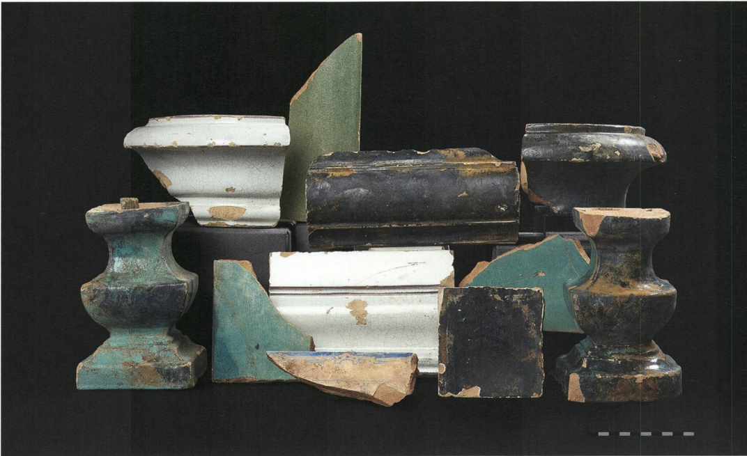
Fig. 6 : La Neuveville, Rue du Faubourg 27. Quelques carreaux de poêle provenant du comblement de la fosse cuvelée. Ces pièces datées du dernier tiers du 18 e siècle témoignent du confort du bâtiment avant sa transformation en locatif, vers 1900.

cuvelage en bois d'environ 150 × 200 cm, comblé avec de la démolition comportant de nombreux carreaux de poêle, fut partiellement arraché. Des problèmes d'infiltration d'eau massive n'ont pas permis d'en réaliser un relevé précis. Par contre, quelques carreaux de poêle extraits du comblement de la structure donnent une idée des fourneaux qui équipaient le bâtiment avant sa transformation en logements, probablement vers 1900. Parmi les fragments collectés, on découvre douze catelles de corps lisses, majoritairement de couleur vert-turquoise, huit fragments de plinthe et de corniche, certains en faïence blanche ornée de filets violacés, et huit pieds balustres complets de couleur turquoise et noirâtre (fig. 6). Un fragment de corniche à moulure en cavet surmonté d'un quart-de-rond s'apparente aux productions du potier yverdonnois Jacob Ingold, dans le dernier quart du 18 e siècle (Kulling 2001, 19 et 78). Les pieds en balustre de style Louis XV renvoient à la même époque. Les fragments restent trop peu nombreux pour que l'on puisse juger de la qualité des équipements de chauffage, mais il est évident que ces éléments appartiennent à plusieurs fourneaux.