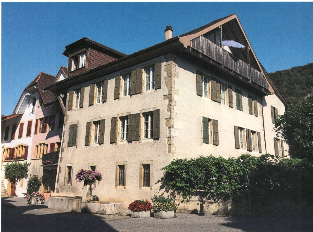
Fig. 2: La Neuveville, Rue du Faubourg 27. Le bâtiment avant sa transformation. Vue vers le nord-ouest.

sement équarris et posés sur un dallage préparatoire en léger ressaut, chargé de stabiliser la fondation. La première assise atteint 68 cm de hauteur, la seconde 66 cm, alors que les blocs les plus gros mesurent jusqu'à 112 cm de longueur. Le même mode de construction a été appliqué en façade sud, sur toute la hauteur du rez-de-chaussée. Ceci conférerait au bâtiment une impression de « maison forte », renforcée par sa position dominante en tête de rue. La date de 1621 taillée sur le portail du cellier renvoie sans doute à la construction du bâtiment. En revanche, sa hauteur originelle n'est pas connue. En façade est, on note la présence de deux séries de trois corbeaux en calcaire qui se rapportaient probablement à des appentis en bois appuyés contre la maison.