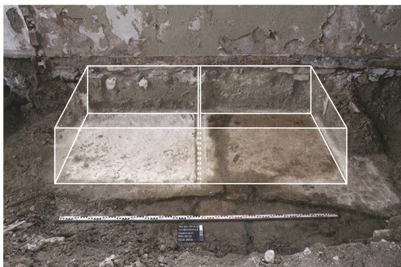
Fig. 3: La Neuveville, Rue du Faubourg 27. Vue de la dalle calcaire monolithique apparue sous les remblais du 20 e siècle. Les rainures taillées accueilleraient des éléments calcaires verticaux qui délimitaient deux bassins (restitution en blanc). Vue vers le sud.

L'intervention du SAB devait se limiter à la documentation de l'ancien mur de façade devenu mur mitoyen ; mais l'apparition de structures rectangulaires arasées en pierre de taille sous les remblais modernes du rez-de-chaussée attisa notre curiosité. À l'intérieur, au pied du mur méridional percé de quatre baies, trois structures sont apparues : une dalle monolithique de calcaire, un négatif rectangulaire lié à l'arrachement d'une seconde dalle calcaire