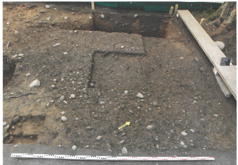
Abb. 4: Studen, Gumpboden. Fläche 2. Die rechtwinklige Struktur wurde im Profil (links) angeschnitten, rechts davon der Sondiergraben von 1937/38.