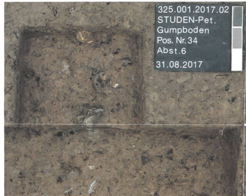
Abb. 3: Studen, Gumpboden. Fläche 1. Detailaufnahme des Münzdepots.

Die Ausgrabung in Tempel 1 wurde mittels LiveCam ins Neue Museum Biel übertragen. Somit konnte man dort während der Sonderausstellung «Petinesca – Aus dem Innern eines Hügels» die Studierenden beim Ausgraben und Dokumentieren beobachten. Die neusten Ausgrabungen sind also – wie bereits diejenigen vor 80 Jahren – mit bewegten Bildern dokumentiert und entsprechend als Zeitdokument für den Sommer 2017 abgelegt.