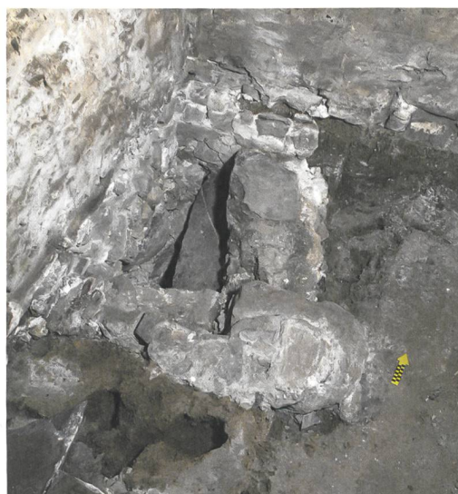
Abb. 5: Brienz, Oberdorfstrasse 92. Treppenabgang von der Rauchküche des Kernbaus von 1495/1498 ins Kellergeschoss. Bei der Teilung des Hauses wurde er zugemauert. Blick nach Westen.

Abb. 4: Brienz, Oberdorfstrasse 92. Oberer Abschnitt der zweigeschossigen Rauchküche mit der rückwärtigen Giebelwand des Blockbaus von 1498. Die Wand darunter wurde erst nach Aufgabe der Rauchküche eingefügt. Die Ziegelwand stammt von der Sanierung im westlichen Hausteil 1984. Blick nach Nordwesten.