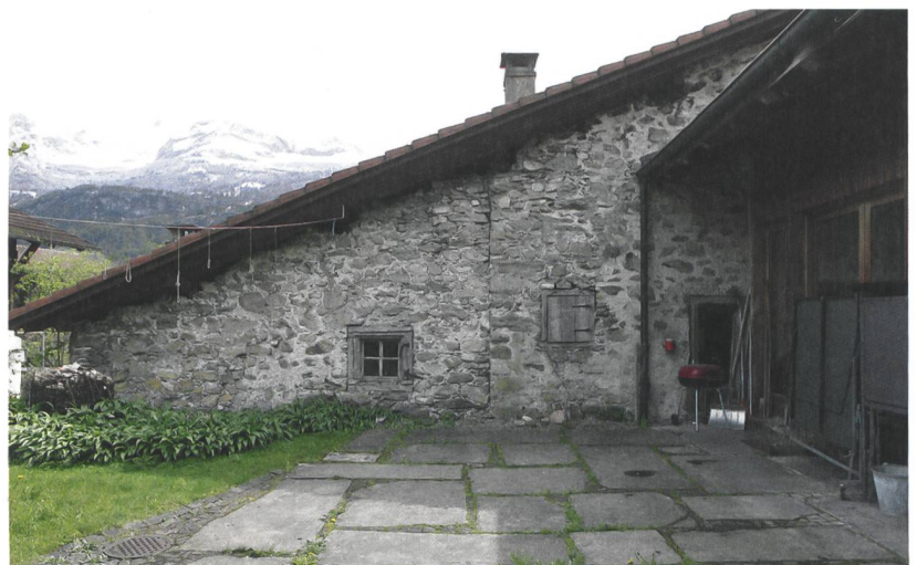
Abb. 2: Brienz, Oberdorfstrasse 92. Hofseite des östlichen Hausteils mit dem gemauerten Küchen- und Gewerbetrakt. Eine Baunaht deutet die östliche Erweiterung an. Rechts schliesst der moderne Trakt der Geigenbauschule an (Oberdorfstrasse 94). Blick nach Süden.

zungsgeschichte des an der ehemaligen Säumer- und Pilgerroute zum Brünigpass gelegenen historischen Gebäudes. Die zu einigen Bauhölzern ermittelten Dendrodaten belegen einen frühen Baubeginn in den Jahren kurz vor 1500.