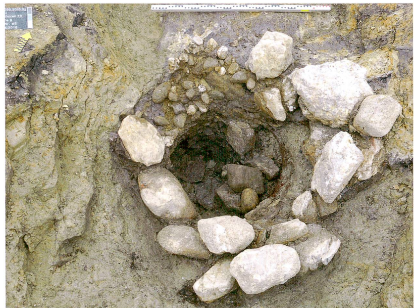
Abb. 5: Thun, Im Schoren 10. Der hölzerne Brunneneinbau zeichnet sich als rotbraune Faserreste ab (rechts am Rand des runden Brunneninnenraums). Senkrechtaufnahme.

Abb. 4: Thun, Im Schoren 10. Profilschnitt durch den spätbronzezeitlichen Sodbrunnen mit gestufter Baugrube und wassersammelnder Kies-schicht auf der Sohle. Blick nach Südosten.