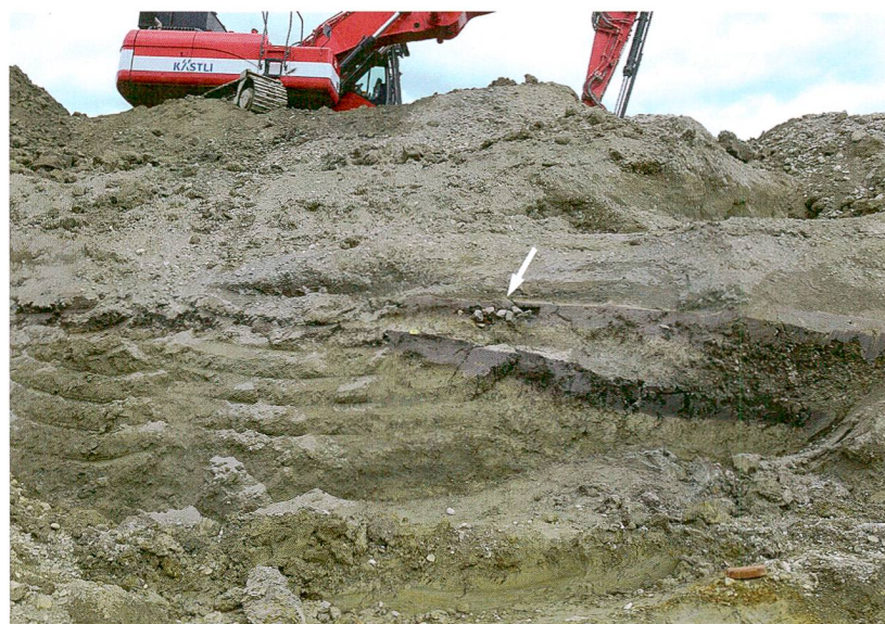
Abb. 7: Thun, Im Scho- ren 20. Der graue Sied- lungshorizont aus der be- nachbarten Parzelle «Im Schoren 10» setzte sich bis in dieses Baufeld fort, aber Funde und Struktu- ren konzentrierten sich auf eine kleine Fläche. Die erste Grube zeichnete sich als Konzentration hitzegepresster Steine und Holzkohle ab (Pfeil). Blick nach Nordosten.

wie in Einigen liegen. Vom Seebecken am Aus- fluss des Sees fehlten aber Hinweise auf Sied- lungen. Dies änderte sich mit dem Nachweis einer bronze- und hallstattzeitlichen Nutzung des Thuner Schlossberges und der Entdeckung der Fundstelle vor der Schadau 2014. Mit den neuen, hier vorgestellten Siedlungen verdich- tet sich das Bild der Nutzung des Seebeckens weiter. Bestattungen, deren Grabbeigaben in die gleiche Zeit gehören wie das ältere Dorf im Schoren und vielleicht die ältere Phase in der Schadau, wurden 1946 im 1,8 km entfern-