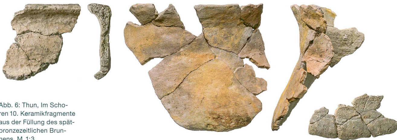
Abb. 6: Thun, Im Scho- ren 10. Keramikfragmente aus der Füllung des spät- bronzezeitlichen Brun- nens. M. 1:3.