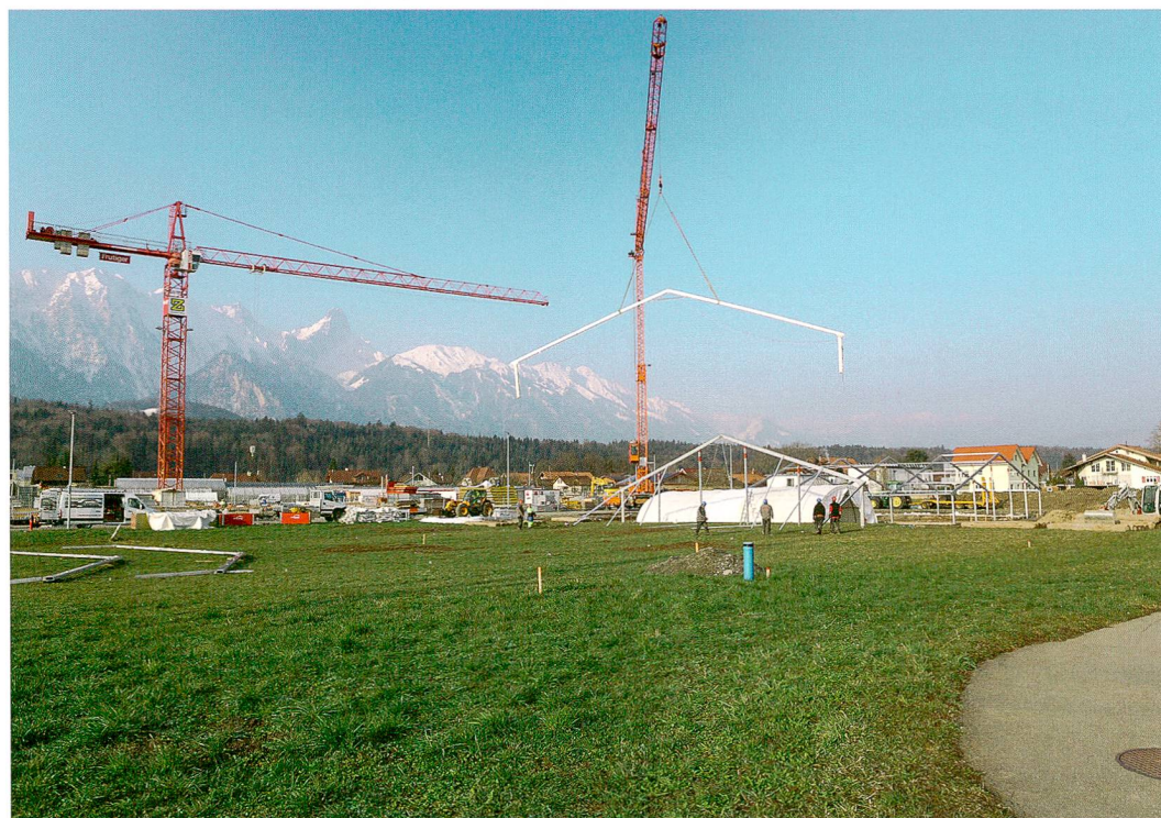
Abb. 1: Thun, Im Schoren 10. Nachdem die erste Teilfläche ausgegraben wurde, wird das Zelt umgestellt, damit auch bei winterlicher Witterung gearbeitet werden kann. Blick nach Osten.

REGULA GUBLER, MARCO AMSTUTZ UND LEONARDO STÄHELI