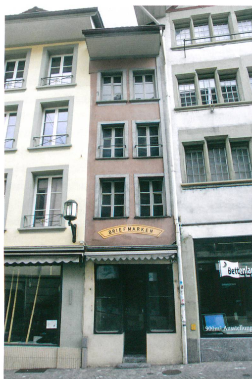
Abb. 2: Thun, Obere Hauptgasse 75. Fassadenansicht mit Blick nach Norden. Das Erdgeschoss wurde 1910 mit einer Schaufensterfront versehen. Die übrige Fassade zeigt die Gliederung aus der Zeit des sogenannten Rüfenacht-Hauses vor 1780, rechts das sogenannte Tschagggeny-Haus. Aufnahme von 2014.

Den hinteren Hausteil schliesst eine Bruchsteinmauer ab. Sie verlief einst weiter ostwärts und reichte bis ins heutige Nachbargrundstück Nr. 77 hinein. Die Mauer gehörte zum rückwärtigen Teil des ältesten Hauses (Abb. 3, Phase 1). Dort erhielt sich auch das originale Fussbodenniveau, welches über einen Meter höher als dasjenige im Vorderteil des heutigen Gebäudes lag. Zur übrigen Gestalt des ältesten Hauses fehlen verlässliche Informationen.