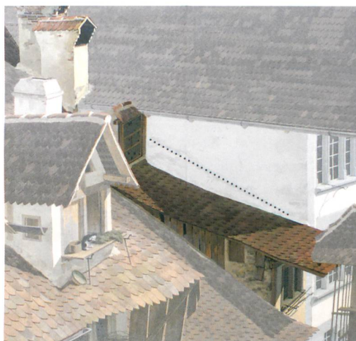
Abb. 4: Thun, Obere Hauptgasse 75. Der Ausschnitt aus dem Thun-Panorama von Marquard Woher zeigt die Häuser Nr. 77 (rechts oben) und Nr. 75 (links daneben) im Zustand des frühen 19. Jahrhunderts. Die Punktlinie markiert den Abdruck des älteren Daches.