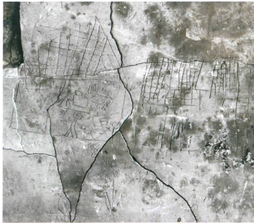
Abb. 5: Thun, Obere Hauptgasse 75. In den Verputz eingebrachter Sgraffito an der Ostwand des gassenseitigen Raumes in ersten Obergeschoss. Die Ritzungen entstanden zwischen dem frühen 18. Jahrhundert und der Zeit vor 1780. Sie zeigen zwei häusliche Alltagsszenen in einem längs und einem quer geschnittenen Haus inmitten von Blumen. M. 1:4.