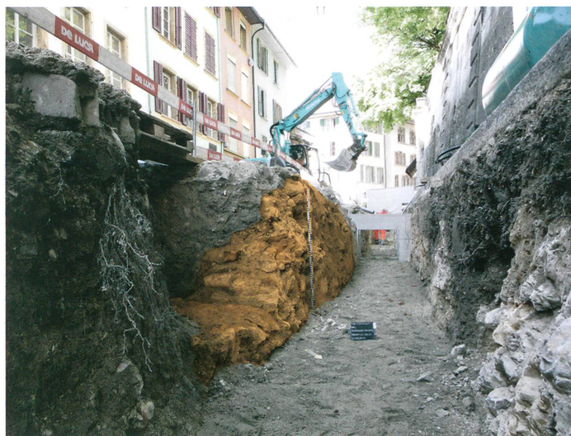
Fig. 4: Bienne, rue Basse. À gauche, quasi au milieu de la chaussée, les fondations de l'ancien mur de soutènement de l'esplanade de l'église; en haut à droite, le mur actuel édifié vers 1841. Vue vers le sud-est.

Ces travaux de génie civil ont offert l'opportunité de préciser le potentiel archéologique des zones bordières de la rue des Maréchaux et de la rue Basse, en mettant notamment en évidence les stigmates d'une occupation alto-médiévale, dont la nature nous échappe pour l'heure. Ils auront également permis de documenter les vestiges de deux tours-portes associées à l'enceinte urbaine médiévale.