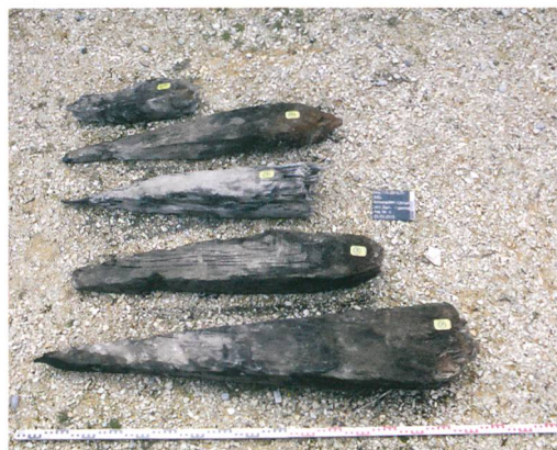
Fig. 3: Bienne, rue des Maréchaux. Les cinq pieux en chêne extraits de la tranchée principale, à l'ouest de la tour de l'Horloge.