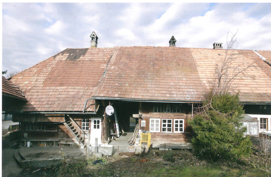
Abb. 1: Wichtrach, Oberdorfstrasse 18/20. Das Mehrfach-Taunerhaus von der Südseite. Das nachträglich angehobene Dach der östlichen Hausteile bringt die Uneinheitlichkeit des Gebäudes zum Ausdruck.

Der westliche, zur Gasse gerichtete Hausteil wurde offenbar in einem Zuge über einem