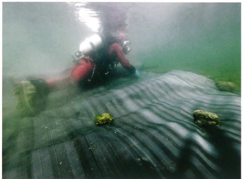
Abb. 4: Sutz-Lattrigen, Rütte. Über der Erosionskante werden als Schutzmassnahme Geotextile ausgebracht, die dann mit einer Kiesschüttung beschwert werden.

Selim Sayah, Stephan Mai, Jean-Louis Boillat and Anton Schleiss, Field measurements and numerical modeling of windwaves in lake Biel: a basic tool for shore protection projects. In: Proceedings of the XXXI International Congress of the Association for Hydro-Environment Engineering and Research (IAHR,) 11–16 september 2005, Seoul, vol. Theme E, 4332–4343.