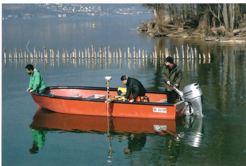
Abb. 2: Sutz-Lattrigen, Rütte. Mit dem Echolot wird der Seegrund vermessen.

Die Siedlungsreste an der ausgesetzten Landspitze werden bereits seit den 1980er-Jahren im Rahmen verschiedener Projekte untersucht, dokumentiert und beobachtet. Im vergangenen Jahr fand eine Evaluation der Erosionsprozesse statt, welche die Siedlungsareale gefährden und zerstören.