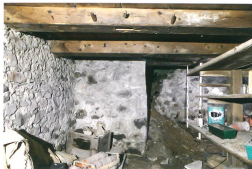
Abb. 2: Saanen-Gstaad, Litzistrasse 21. Die Ostwand im südlichen Kellerraum weist einen auffälligen Versatz auf. Auf zwei Dritteln der Länge ist sie um 1,4 m nach Osten versetzt. Der Grund hierfür bleibt unbekannt. Blick nach Osten.

Das Kellergeschoss bestand aus zwei nahezu gleich grossen Räumen, die im Bereich der Firstlinie durch eine Binnenmauer getrennt