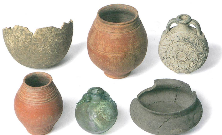
Abb. 5, rechts: Unterseen, Baumgarten 25. Feldflasche aus Körpergrab 2013-K2. Die Vorder- und Rückseite stammen vom gleichen Model, wie man aufgrund der kleinen Unregelmässigkeiten feststellen kann. M. etwa 1:2.