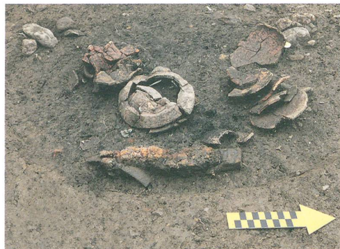
Abb. 3: Unterseen, Baumgarten 25. Brandgrab 2013-B5, Einfüllung. Blick nach Westen.

Der geplante Neubau eines Einfamilienhauses im Nachbargrundstück Baumgarten 25 (Parzelle 1078) veranlasste den Archäologischen Dienst des Kantons Bern im März 2013 zu vorgezogenen Flächensondierungen. Nachdem diese erwartungsgemäss positiv ausfielen, schloss sich von Ende April bis Mitte Juni 2013 eine Grabung an.