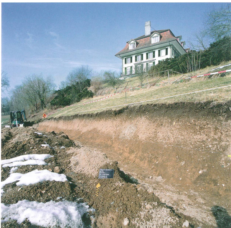
Abb. 1: Bern, Elfenau. Sondierschnitt im Hangbereich der Parkanlage von 1814 unterhalb des Herrenhauses aus der Zeit um 1780. Blick nach Norden.

Die Elfenau ist heute ein beliebtes Ausflugs- und Erholungsziel der Stadt Bern. Ihre Ursprünge reichen in das ausgehende 13. Jahrhundert zurück, als wahrscheinlich auf der Geländeterrasse oberhalb der Aare kurzzeitig ein kleines Kloster mit Kapelle eingerichtet war. Zugehörige Gebäude und die exakte Lage des Frauenkonventes kennen wir bislang nicht. Gemäss Überlieferung wurde das Frauenkloster 1285 von Mechthild von Seedorf in «Brunnadern» (St. Bernhardsbrunn) gegründet. Als Rudolf von Habsburg 1288 die Stadt Bern belagerte, flohen die Klosterfrauen und verlegten ihren Konvent auf die Aareinsel am heutigen Altenberg bei Bern (Inselkloster). Ein enger Bezug zwischen der Gründung des Brunnadernklosters und dem vor Ort hervortretenden Quellhorizont ist durch den Namen belegt. Bis 1528 blieb das Klostergut im Besitz des Prediger-