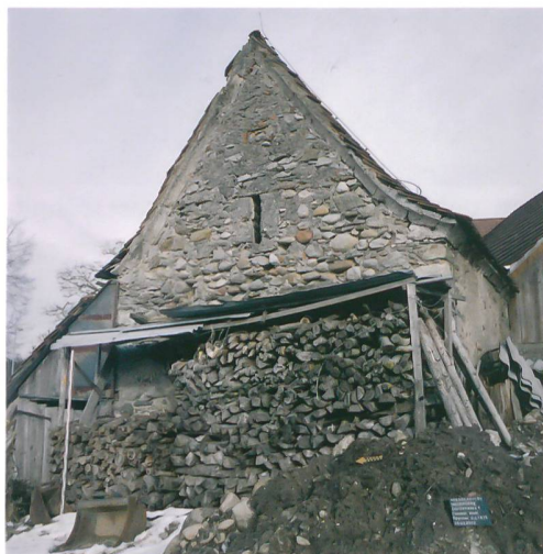
Abb. 4: Niederönz, Dörfli- strasse. Der unmittelbar östlich der Grabungs- fläche gelegene Heiden- stock aus dem frühen 17. Jahrhundert. Blick nach Nordosten.