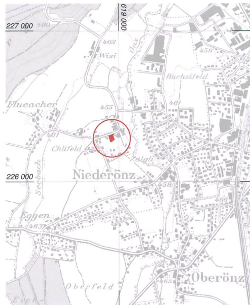
Abb. 1: Niederönz, Dörflistrasse. Lage der Grabungsfläche. M. 1:25 000.

Die archäologischen Schichten lagen direkt unter dem Humus und können in vier Hauptphasen unterteilt werden (Abb. 2). Von einer