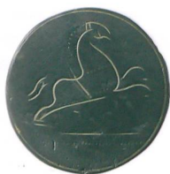
Abb. 5: Niederönz, Dörfli- strasse. Bauernknopf aus dem 19. Jahrhundert, Bronze. M. 1:1.

und Lehmestrichboden oder als dreiteiliger Bau mit den Massen 8,3 \times 6,4 m rekonstruiert werden. Auch der östliche Teil dürfte ein Ständerbau gewesen sein, es konnten aber aufgrund der schlechten Schichterhaltung keine Schwellbalkengräben nachgewiesen werden. Anlass zum zweiten Rekonstruktionsvorschlag gab ein leicht eingetiefter Werkplatz mit kompakter Kiesoberfläche, Spuren von Stickeln und Holzkohle, der 3 m östlich und parallel zum gut fassbaren Lehm Boden lag. Dieses Gebäude darf als