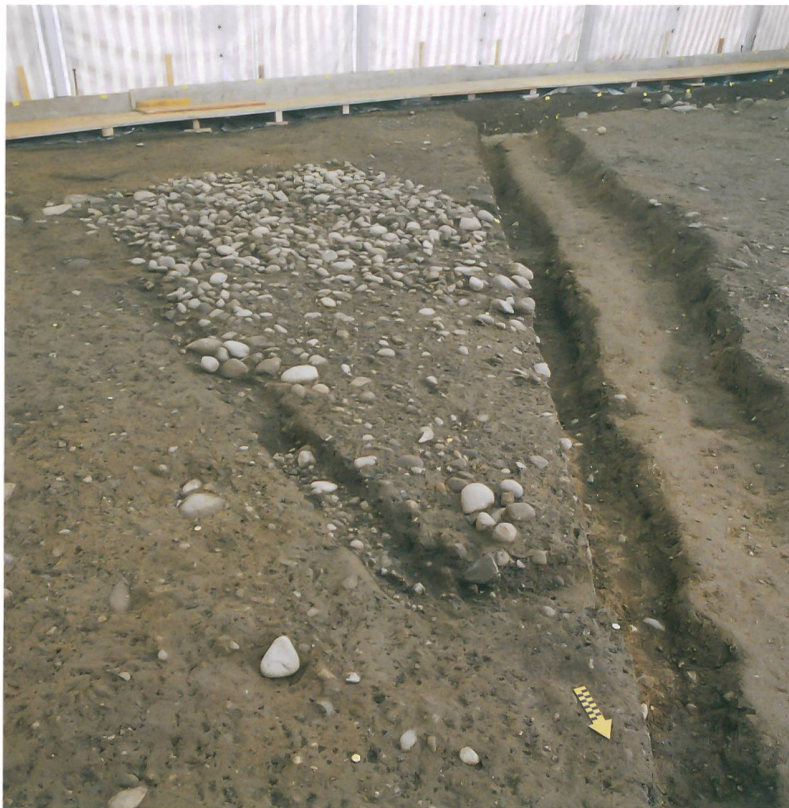
Abb. 3: Niederönz, Dörfli- strasse. Westliches Ende des grösseren frühneu- zeitlichen Gebäudes. Gut erkennbar sind der Schwellbalkengraben und der Steinunterbau des Bodens. Blick nach Süd- osten.