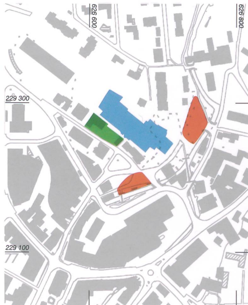
Abb. 1: Langenthal. Ausschnitt des heutigen Stadtkerns. Eingezeichnet sind die Grabungsprojekte im Wuhrquartier seit 2009. Blau: «Wuhrplatz» 2009/10. Rot: «Wuhr» 2010/11. Grün: «Käsereistrasse» 2011/12. M. 1:5000.

gleich ausgerichtet wie die Grubenhausgruppe vom «Wuhrplatz». Eine gemeinsame Zugehörigkeit, etwa zu einem Gehöft, ist daher wahrscheinlich. Nördlich des Grubenhauses fanden sich Spuren von regelmässig angeordneten Pfostengruben, die den Standort eines Wohnhauses