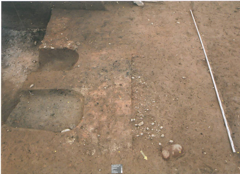
Abb. 3: Langenthal, Käsestrasse. Links: Zwei bereits ausgegrabene Kadavergruben. Rechts im Vordergrund: Eine Feuerstelle mit Kiesunterlage. Im Hintergrund: Feuerstelle mit erhaltener Oberfläche. Blick nach Südwesten.