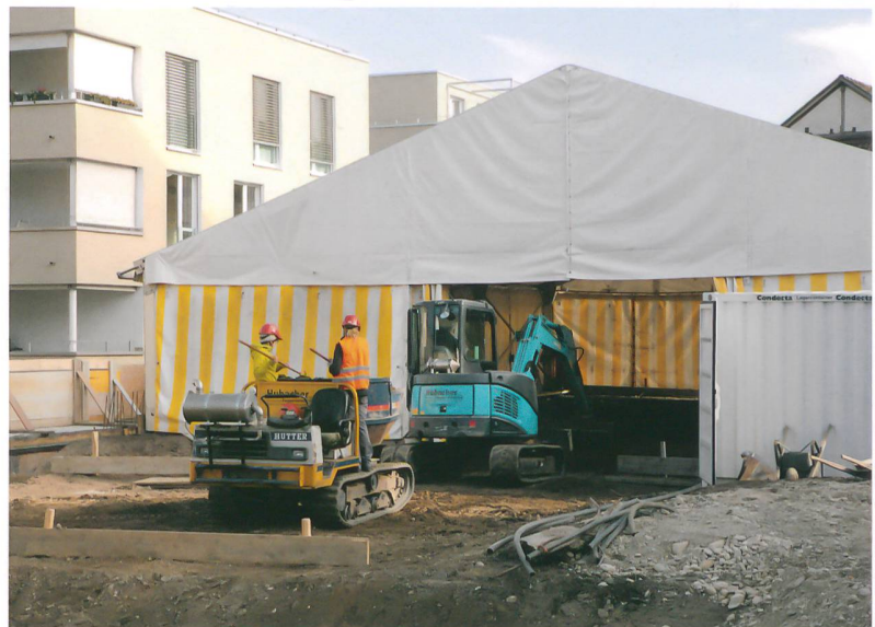
Abb. 2: Langenthal, Käsereistrasse. Mit einem Bagger tragen Mitarbeiterinnen und Mitarbeiter des Archäologischen Dienstes das Sedimentpaket ab und lesen die Funde heraus. Blick nach Osten.