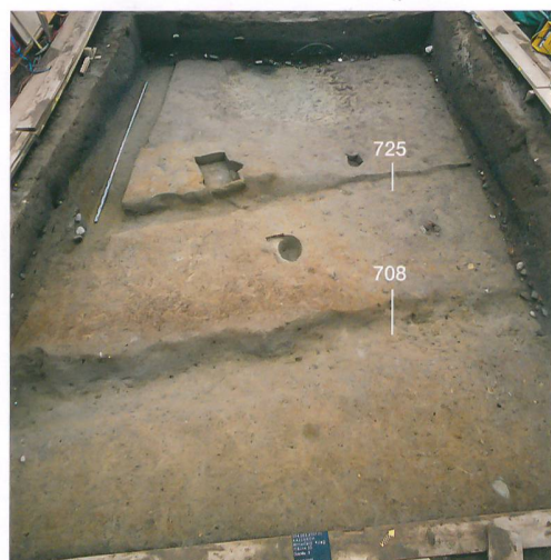
Abb. 5: Kallnach, Hinterfeld. Quer durch eine Grabungsfläche ziehen die parallel laufenden Gräben 708 und 725. Blick nach Nordwesten.

recht steil an. Von dort her wurde im Laufe der Jahrhunderte eine knapp achtzig Zentimeter starke Schwemmschicht eingetragen, unter welcher die Befunde lagen. Allerdings kamen im unteren Bereich dieser Sedimentschicht bereits römische und auch prähistorische Keramikfragmente vor, die von Aktivitäten hangaufwärts stammen dürften. Ausserdem verhindern lehmige Schichten das Versickern des Wassers, so dass dieses unter der Oberfläche auf dem Lehm langsam talwärts fliesst. Vor allem im flacher werdenden Westteil der ausgegrabenen Fläche hat Staunässe den Boden teilweise dunkelgrau verfärbt. Diese Sedimenteinträge, die hydrologischen Bedingungen und eine kontinuierliche Bewirtschaftung hatten zur Folge, dass sich keine eindeutigen Schichtgrenzen erkennen liessen. Verfärbungen von Pfosten, Gruben und Gräben zeichneten sich oft erst im gewachsenen Untergrund ab. Daher lässt sich vieles nicht eindeutig einem Zeithorizont zuweisen.