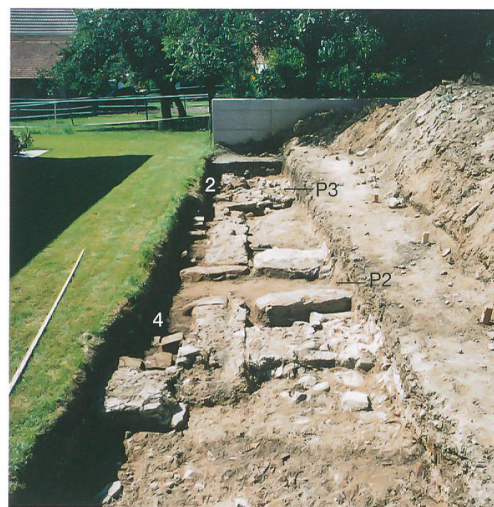
Abb. 2: Kallnach, Hinterfeld. Die Fläche südöstlich des Badetraktes. Im Hintergrund der Graben 455. Quer durch die Fläche zieht der Kanal 475, links die Hofmauer 131. Moderne Leitungsgräben stören den Befund. Blick nach Süden.

Die ersten Ergebnisse der Ausgrabungen im römischen Gutshof von Kallnach, Hinterfeld sind im Jahrbuch 2009 vorgestellt worden. Von 2009 bis 2012 konnten im Areal, das an die Grabungen von 1999 und 2007/08 angrenzt, zusätzliche Flächen von insgesamt 2215 m 2 archäologisch untersucht werden. Diese Arbeiten brachten weitere Teile der Badeanlage zur römischen Villa sowie römische und prähistorische Strukturen ausserhalb des ummauerten Gutshofgeländes zum Vorschein.