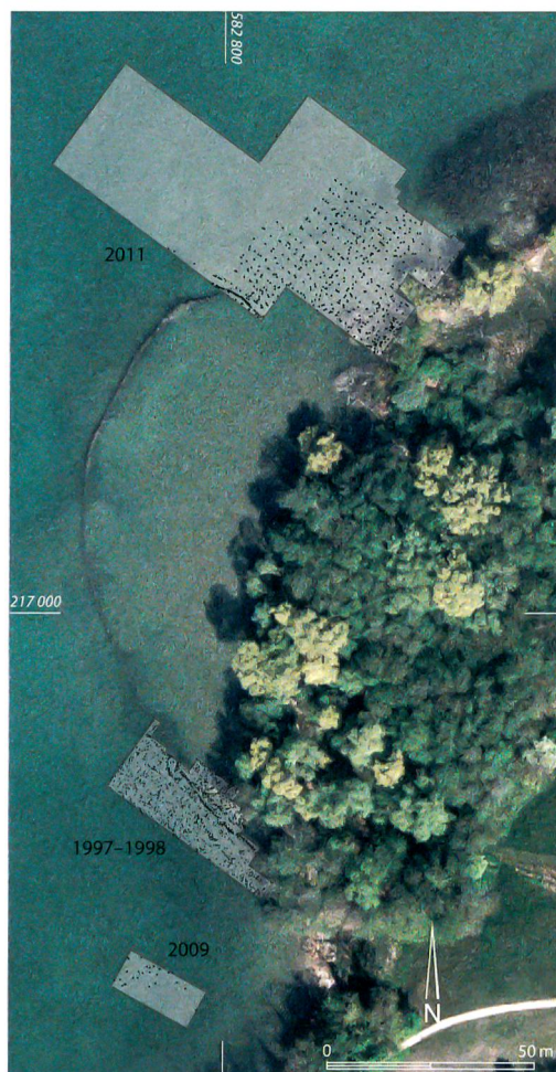
Abb. 1: Sutz-Lattrigen, Rütte. Pfahlfelder der Rettungsgrabungen 1997/98, 2009 und 2011. Sie repräsentieren mehrere Dorfanlagen aus der Zeit um 2700 v. Chr.

len, nämlich im Schlattwald und am See unterhalb der Kirche römische Gebäude gestanden haben. Etwa 100-150' vom Ufer findet sich Pfahlwerk ähnlich demjenigen von Nidau, etwa 6' unter dem Wasser und kaum einen Fuss über den Boden hervorragend, ... ». Kellers publizierter Bericht über die Fundstelle beruht auf den Beobachtungen der lokalen Pioniere, des Notars Emanuel Müller, Nidau, und des Privatiers und Obersten Friedrich Schwab, Biel, die ab 1843 ihre später berühmten Sammlungen mit Fundmaterial vom Seegrund erweiterten. Theophil Ischer vermerkte 1928 zu Sutz lapidar: «Im Pfahlbau Sutz wurde von E. Müller 1854 der erste steinzeitliche Fund der Bielerseepfahlbauten gehoben» . Es sollte nicht der letzte sein, denn in den 1870/80er-Jahren führten die regionalen Protagonisten Victor Gross, Mediziner aus La Neuveville, und Edmund von Fellenberg, Geologe aus Bern, Grabungen durch. Nach 1884 wurde es ruhig um die Fundstelle. Forschungsgeschichtlich interessant sind die Arbeiten von Christian Strahm der 1970er-Jahre, der mit dem Fundmaterial aus den von Fellenberg'schen Grabungen seine «Gliederung der schnurkeramischen Kultur in der Schweiz» entwickelte. Der Glockenbecher von Sutz schliesslich ist eines der meistpublizierten Gefässe der schweizerischen Urgeschichte, da er aus ungewöhnlichem Seeuferkontext stammt.