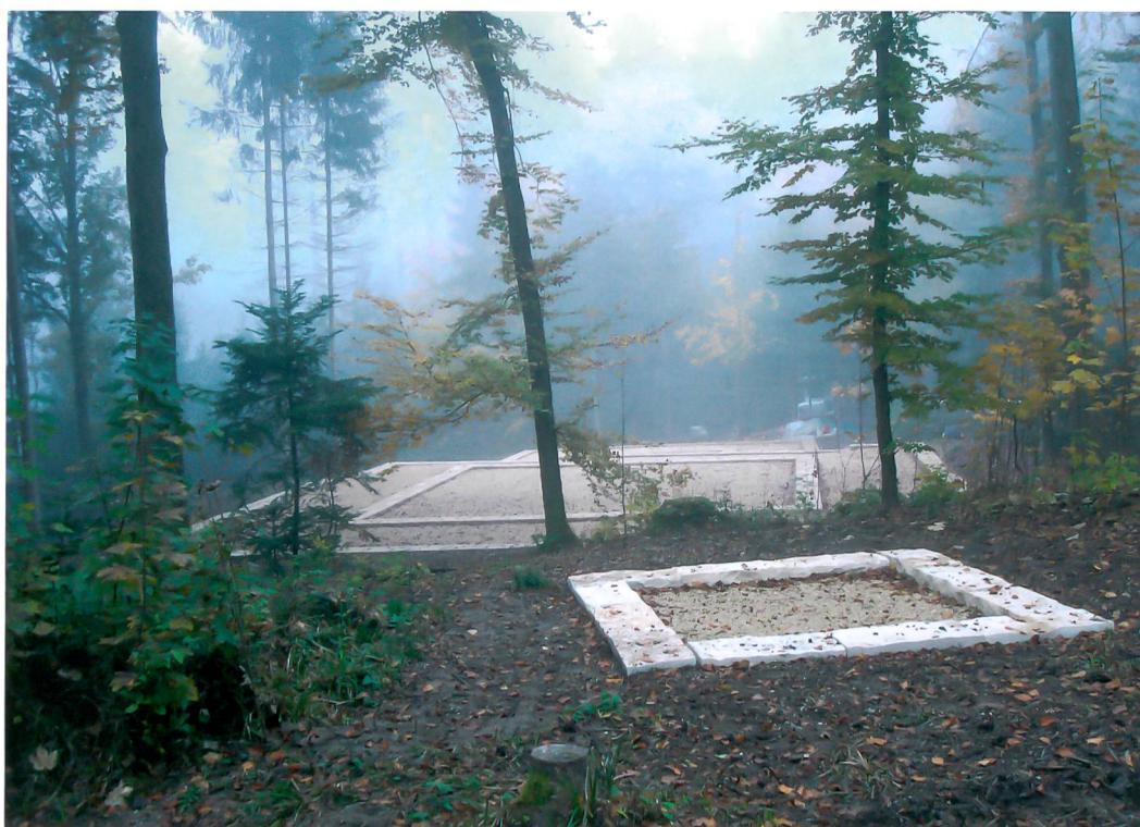
Abb. 1: Studen-Petinesca, Gumpboden, 2011. Nach der Instandstellung lädt der Tempelbezirk auf dem Gumpboden wieder zu Besuchen und zum Verweilen ein.

Wunsch des Archäologischen Dienstes des Kantons Bern einen Holzschlag durch. Planung, Finanzierung und Auftragsvergabe für die Neugestaltung nahmen danach noch einige Zeit in Anspruch. Doch im April 2011 konnte mit der Arbeit begonnen werden. Ziel war, sämtliche Gebäudegrundrisse und Teile der den heiligen Bezirk umschliessenden Temenosmauer durch Bodenmarkierungen sichtbar zu machen. Ein neues Netz von Fusswegen sollte durch die ursprünglichen Tore in der Umfriedung in die Anlage führen und innerhalb des Bezirks zu Rundgängen einladen (Abb. 2). Ein kleines Team des Archäologischen Dienstes führte sämtliche Erdarbeiten aus, und die Equipe eines Gartenbauunternehmens übernahm den Bau der Markierungen und Wege.