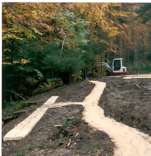
Abb. 4: Bild oben und in der Mitte: Studen-Petinesca, Gumpboden, 2011. Die Tempel 6 (im Vordergrund) und 4 vor und nach der Instandstellung. Was bis vor Kurzem von den einen als Idylle und von anderen als Schandfleck bezeichnet wurde, ist nun für die Besucher wieder sichtbar und verständlich.