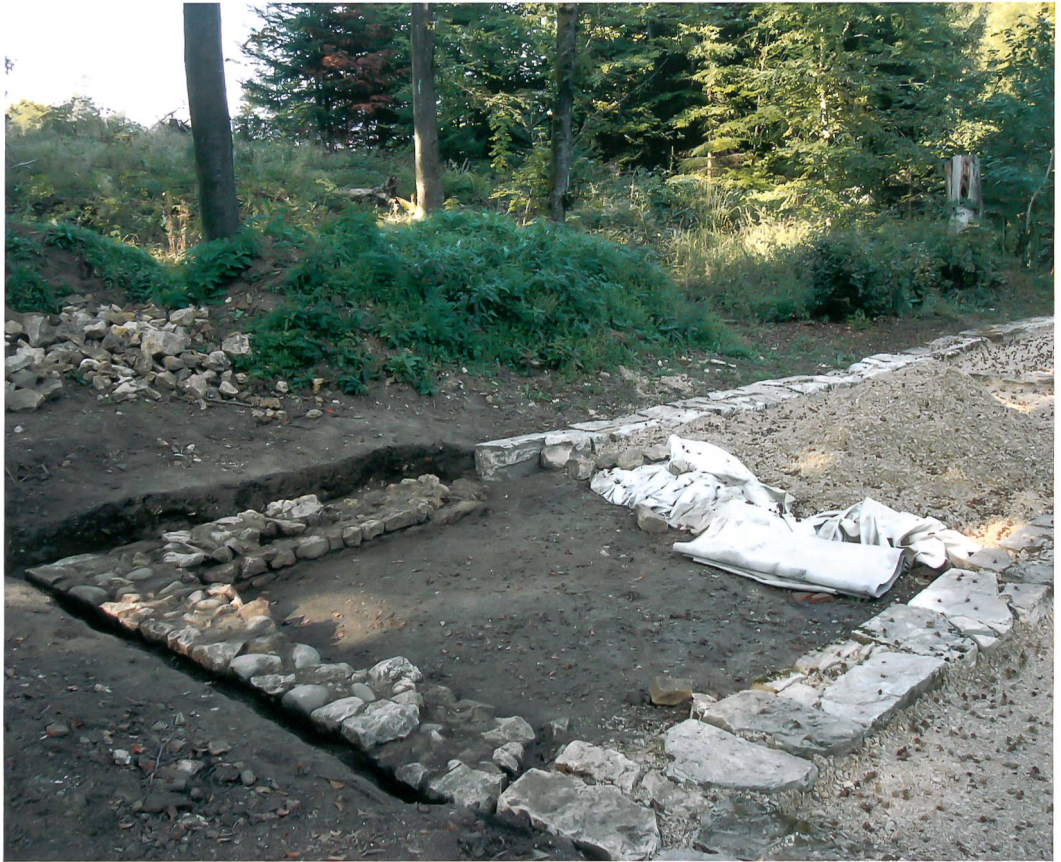
Abb. 3: Studen-Petinesca, Gumpboden, 2011. Die Originalsubstanz der Gebäude war stellenweise bloss wenige Zentimeter mit Humus überdeckt. Als Beispiel hier die Westecke des Mehrzweckgebäudes. In der Verlängerung der römischen Mauerreste erkennt man die Kalksteinblöcke der Mauermarkierung von 1937 bis 1939.

Bäumen befreiten Gebäudegrundrissen waren natürlich die Wurzelstöcke zurückgeblieben. Um diese ohne Beschädigung des Untergrunds zu entfernen, liessen wir sie mit einer Stockfräse bis rund 20 cm unter der Oberfläche abtragen. Rund 100 Baumstrünke mussten auf diese Weise beseitigt werden.