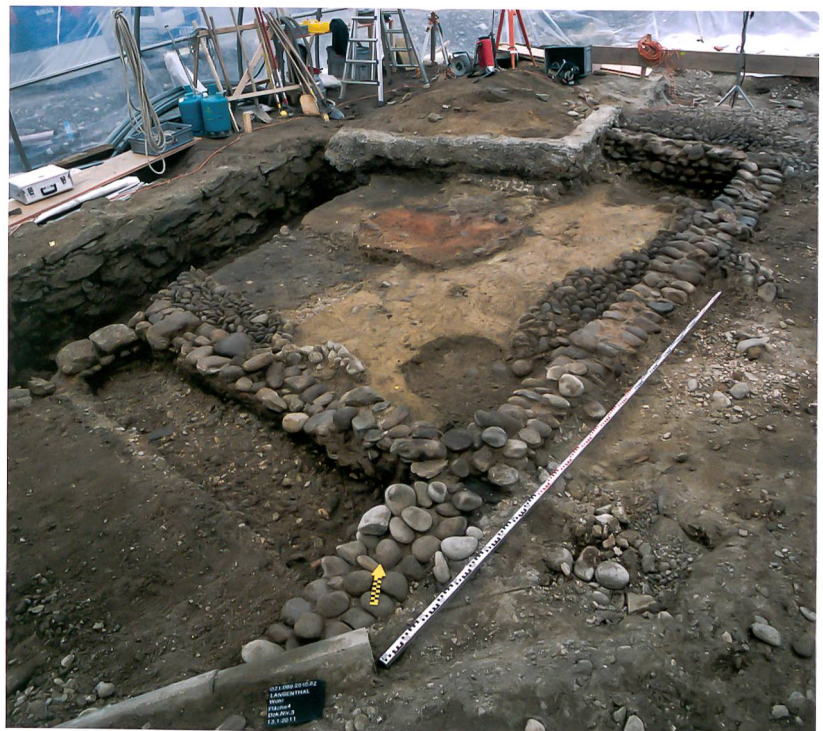
Abb. 4: Langenthal, «Wuhr 2». Feuerstelle in der Küche des Hauses unter dem Schlachthof. Mauerzüge unterschiedlicher Bauphasen. Blick nach Nordwesten.