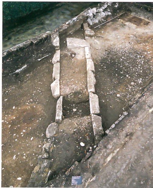
Abb. 3: Langenthal, «Wuhr 1». Querverbindender Kanal zwischen Chrämer- und Waschhaus. Vorne links im Bild liegt der älteste Teil der Kanalwange aus einer Bollen- und Bruchsteinmauerwerk. Dahinter und auf der rechten Seite stehen die Jurakalksteinquader der jüngeren Bauphase. Langgeteseitig verschliesst eine Betonwange den Kanal. Blick nach Süden.

Nach dem Freilegen der Fundamente des Schlachthauses konzentrierten sich die archäologischen Arbeiten auf das darunter liegende ältere Gebäude aus dem 18./19. Jahrhundert. Das Haus war ursprünglich als reiner Holzbau angelegt worden, wie zwei Räume und ein Korridor mit Spuren von Schwellbalken auf Unterlagssteinen zeigten. Möglicherweise nach einem vollständigen Abbruch entstand ein neues Gebäude auf Steinfundamenten mit neuer Raumeinteilung. Einer der Räume darf aufgrund der vorhandenen Herdstelle als Küche angesprochen werden (Abb. 4). Ein jüngerer Umbau veränderte die Raumnutzung im Haus, bei der unter anderem auch die Herdstelle wieder aufgegeben wurde. Grosse bauliche Veränderungen erfolgten in der jüngsten Bauphase, in der das Gebäude stark erweitert wurde und zahlreiche neue Räume erhielt. Die Bauphasen zeigen ein sehr dynamisches Bild der Gebäudeentwicklung und -nutzung. Die Auswertung dieser Grabung folgt direkt auf die laufende Auswertung der Grabung «Wuhrplatz» 2009/10 und soll als Monografie über die drei Grabungsprojekte in Langenthal in den nächsten Jahren erscheinen.