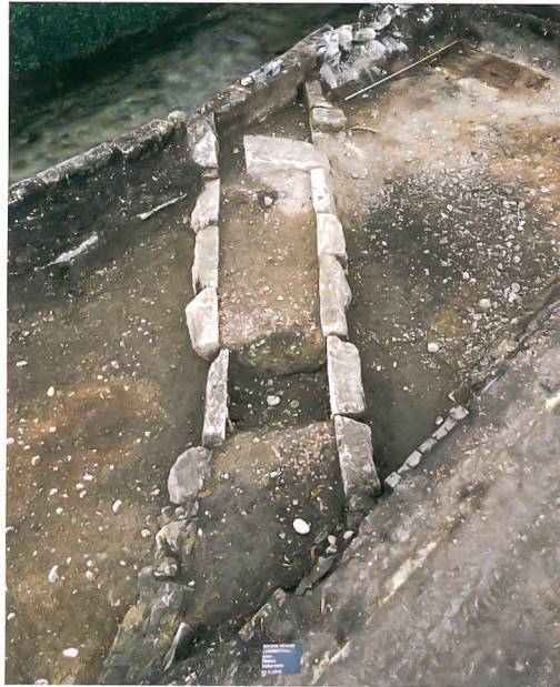
Abb. 3: Langenthal, «Wuhr 1». Querverbindender Kanal zwischen Chrämer- und Waschhaus. Vorne links im Bild liegt der älteste Teil der Kanalwange aus einer Bollen- und Bruchsteinmauerwerk. Dahinter und auf der rechten Seite stehen die Jurakalksteinquader der jüngeren Bauphase. Langgeteseitig verschliesst eine Betonwange den Kanal. Blick nach Süden.

Nach dem Freilegen der Fundamente des Schlachthauses konzentrierten sich die archäologischen Arbeiten auf das darunter liegende ältere Gebäude aus dem 18./19. Jahrhundert. Das Haus war ursprünglich als reiner Holzbau angelegt worden, wie zwei Räume und ein Korridor mit Spuren von Schwellbalken auf Unterlagssteinen zeigten. Möglicherweise nach einem vollständigen Abbruch entstand ein neues Gebäude auf Steinfundamenten mit neuer Raumeinteilung. Einer der Räume darf aufgrund der vorhandenen Herdstelle als Küche angesprochen werden (Abb. 4). Ein jüngerer Umbau veränderte die Raumnutzung im Haus, bei der unter anderem auch die Herdstelle wieder aufgegeben wurde. Grosse bauliche Veränderungen erfolgten in der jüngsten Bauphase, in der das Gebäude stark erweitert wurde und zahlreiche neue Räume erhielt. Die Bauphasen zeigen ein sehr dynamisches Bild der Gebäudeentwicklung und -nutzung. Die Auswertung dieser Grabung folgt direkt auf die laufende Auswertung der Grabung «Wuhrplatz» 2009/10 und soll als Monografie über die drei Grabungsprojekte in Langenthal in den nächsten Jahren erscheinen.