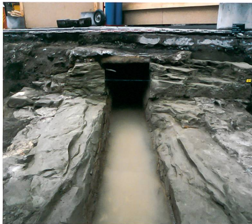
Abb. 3: Bern, Kornhausplatz/ Theaterplatz/Marktgasse. Ansicht des Stadtbachs von Westen (vgl. Abb. 1,2).

Stadtbach in einem Betonrohr, nur am Ende der Gasse waren noch Sandsteine der frühneuzeitlichen Fassung erhalten (Abb. 1,2). Am östlichen Ende der Baustelle, direkt vor dem Zytgloggeturm, floss der Bach unter dem bestehenden Strassenpflaster. An dieser Stelle war diese Sandsteinfassung noch beinahe vollständig erhalten (Abb. 3). Sie bestand aus gut behauenen und auf Sicht bearbeiteten Sandsteinquadern, die seitlich in Tuffsteinen gefasst waren. Alle Abbildungen des 17. bis 19. Jahrhunderts belegen, dass der Stadtbach im Grabenbereich, nachdem dieser zugeschüttet worden war, unterirdisch verlief und erst östlich des Zytgloggeturms in der Kramgasse wieder zum Vorschein kam. Die Überdeckung des Stadtbachs diente der Platznutzung auf dem Areal des zugeschütteten Grabens.