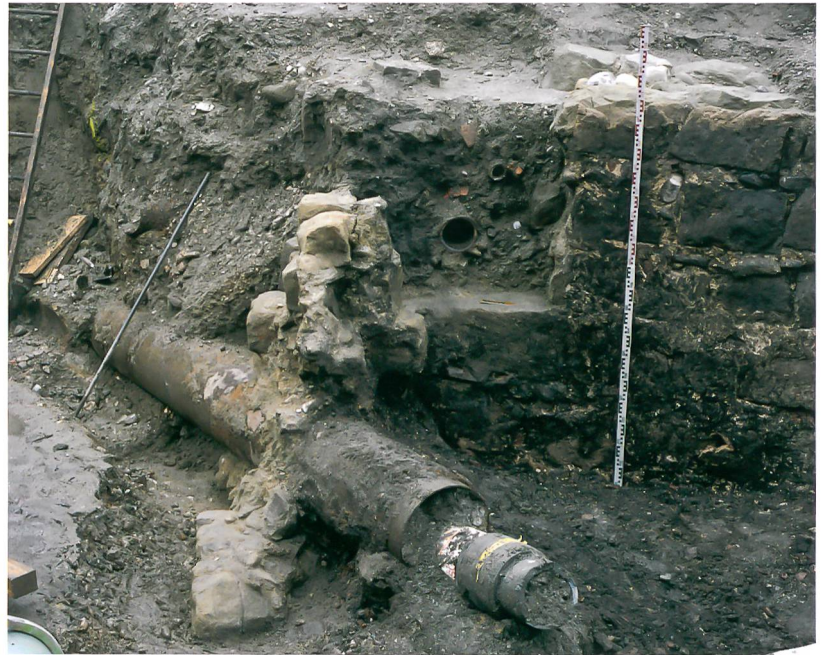
Abb. 2: Bern, Kornhausplatz/ Theaterplatz/Marktgasse. Ansicht der Grabengegenmauer und des Ansatzes der Grabenbrücke von Osten (vgl. Abb. 1,1).

Der zur Zeit der Stadtgründung angelegte Stadtbach fliesst heute weitgehend unbemerkt unter den Gassen Berns und ist nur im Bereich der Gründungsstadt teilweise sichtbar. Auf der Baustelle war der von Osten nach Westen fließende Stadtbach jedoch über die ganze Fläche hin präsent (Abb. 1,2). Das Wasser wurde für die Baustelle ab Mitte der Marktgasse mit Hilfe von einer Pumpanlage hoch- und umgeleitet. In der Marktgasse war von einer mittelalterlichen Fassung nichts mehr zu erkennen, was nicht erstaunt, denn derartige Einrichtungen wurden durch das fließende Wasser stark beansprucht und mussten immer wieder saniert und erneuert werden. Zuletzt verlief der