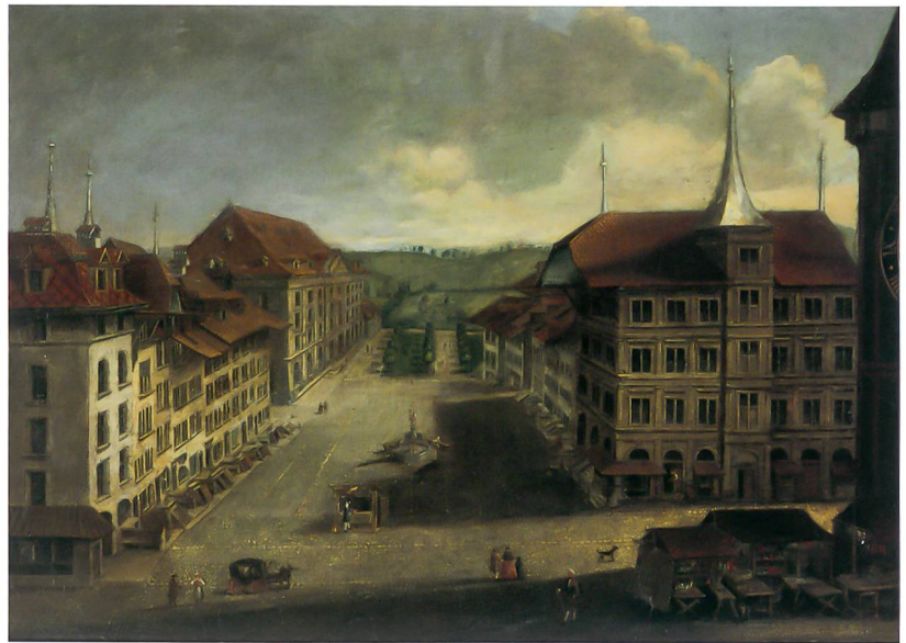
Abb. 8: Bern, Kornhausplatz/Theaterplatz/Marktgasse. Ansicht des Kornhausplatzes in Bern, Ölgemälde von Johann Grimm (1675–1747), Burgergemeinde Bern. Im Vordergrund rechts das Gesellschaftshaus zu Pfistern.