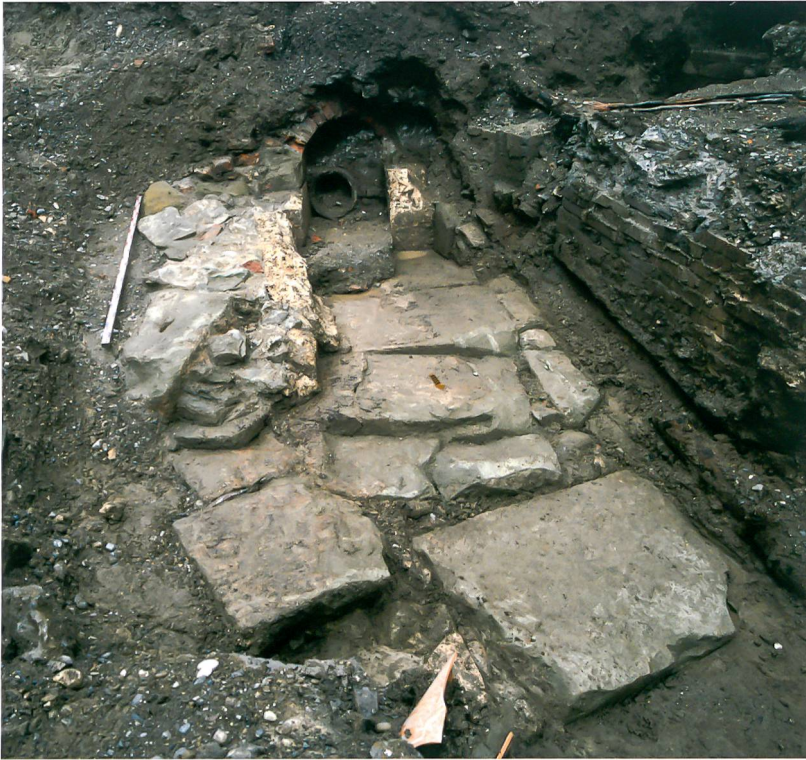
Abb. 4: Bern, Kornhausplatz/Theaterplatz/Marktgasse. Ansicht des Gewerbekanals von Norden (vgl. Abb. 1,3).