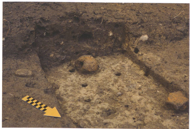
Abb. 3: Langenthal, Wuhrplatz. Auf der Sohle eines Grubenhauses liegen zwei Webgewichte. Sie stammen von einem Gewichtwebstuhl.

Erstmals können nun auf dem Wuhrplatz archäologische Spuren der Siedlung «Langatun» nachgewiesen werden. Dieser Teil der Siedlung präsentiert sich auf den ersten Blick unscheinbar. Sie besteht aus Pfostengruben, Gruben und sogenannten Grubenhäusern. Anhand der Funde können diese Siedlungsreste ins Hoch- bis Spätmittelalter – etwa in die Zeit vom 12. bis zum 14. Jahrhundert datiert werden (Abb. 2). Diese erste Einschätzung wird durch das Vorkommen von Grubenhäusern, kleiner in den Boden eingetiefter Werk- und Vorratshütten, unterstützt. Solche Werkhütten kommen nach bisherigen Kenntnissen nur bis zum Spätmittelalter vor und werden danach durch Keller ersetzt. Funktional sind Grubenhäuser häufig mit der Textilproduktion in Verbindung zu bringen. In Langenthal zeugen unter anderem zwei Webgewichte eines vertikalen Gewichtwebstuhls auf der Sohle eines Grubenhauses von diesem Hauswerk (Abb. 3). Eine besondere Entde-