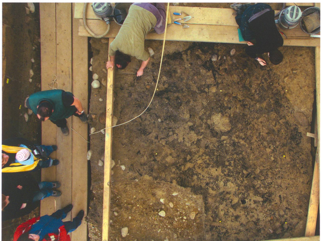
Abb. 1: Langenthal, Wuhrplatz. Ausgrabungsarbeiten an einem mittelalterlichen Grubenhaus mit verbrannten und verstürzten Flechtwerkwänden. Am «Tag des offenen Bodens» erläuterten Mitarbeiter den Besuchern die Bedeutung der Fundstelle.

Die reiche Vergangenheit von Langenthal und seiner nahen Umgebung ist uns aus Schriftquellen und seit dem Bau der Bahn 2000 auch archäologisch bekannt. Im Unterhard liessen sich menschliche Spuren vom 8. Jahrhun-