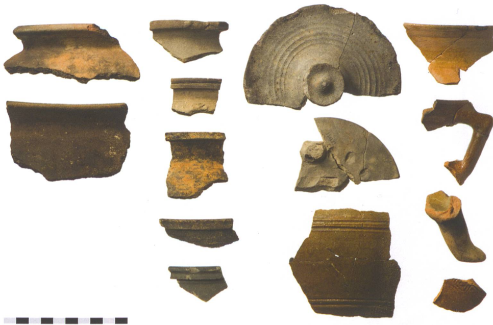
Abb. 2: Langenthal, Wuhrplatz. Ausgewählte Keramikfragmente des 12. bis 14. Jahrhunderts.

dert v. Chr. bis ins 10. Jahrhundert n. Chr. verfolgen. Historisch tritt Langenthal 861 n. Chr. gleich mit zwei schriftlichen Ortsnennungen in Erscheinung. Ein kontinuierlicher Niederschlag in den Schriftquellen erfolgt mehrheitlich erst ab dem 12. Jahrhundert und steht meistens in Zusammenhang mit dem Kloster St. Urban, welches dank einer Schenkung in Langenthal reich begütert war.