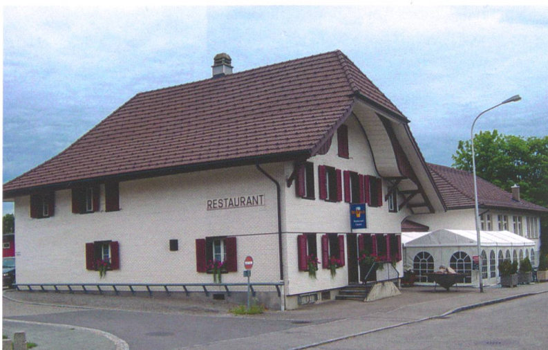
Abb. 1: Köniz-Niederwangen, Wangentalstrasse 46. Der ehemalige Gasthof Löwen (1716 bis 2010).

Der gewachsene Boden wird durch die eiszeitliche Moräne gebildet. Quer durch die Grabungsfläche verlief eine etwa 15 m breite