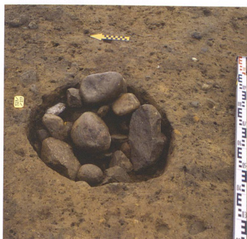
Abb. 4: Köniz-Niederwangen, Wangentalstrasse 46. Die mit Steinen gefüllte Grube 28 diente vielleicht als Unterlage für einen Schwellbalken oder Ständer eines Holzbäudes.