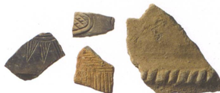
Abb. 5: Köniz-Niederwangen, Wangentalstrasse 46. Eine kleine Auswahl an verzierten spätbronzezeitlichen Wandscherben. M. 1:3.