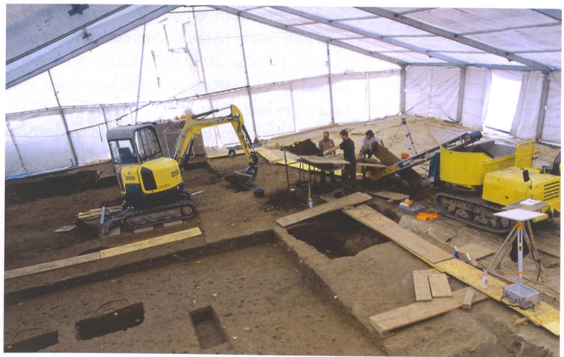
Abb. 3: Köniz-Niederwangen, Wangentalstrasse 46. Grabungsfläche mit Sortiertisch.