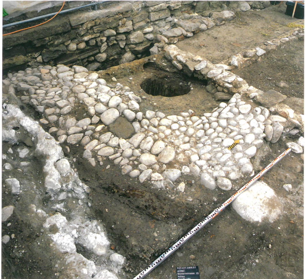
Abb. 7: Köniz, Schloss, Muhlernstrasse 15. Pflasterung und eingetieftes Regenwasserfass ausserhalb des Gebäudes des 18. Jahrhunderts.