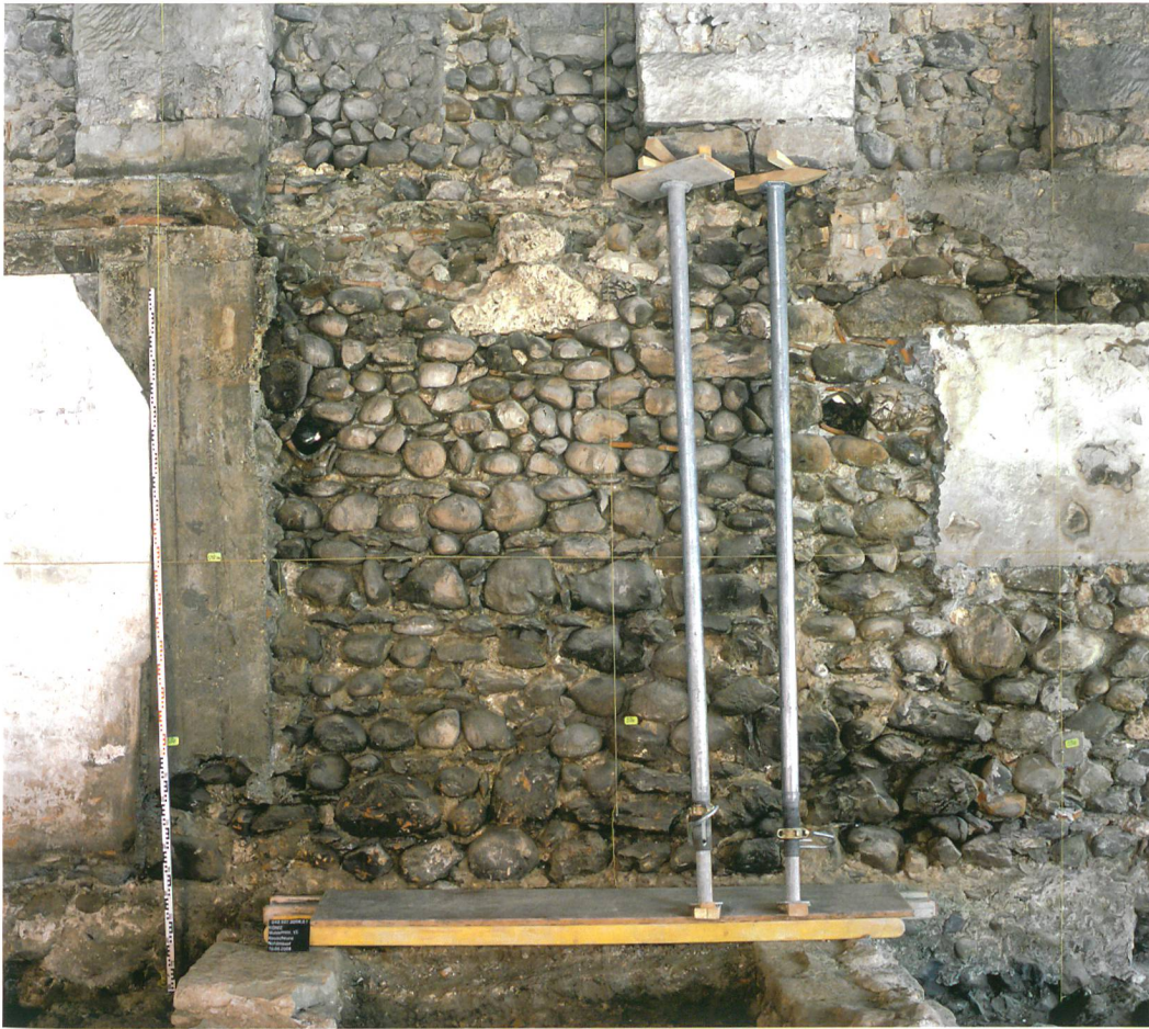
Abb. 5: Köniz, Schloss, Muhlenstrasse 15. Detailansicht des mittelalterlichen Mauerwerks.