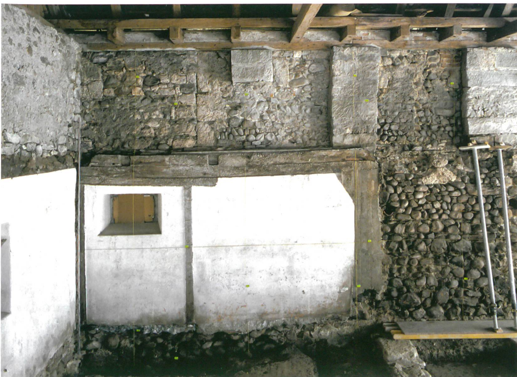
Abb. 6: Köniz, Schloss, Muhlenstrasse 15. Ansicht der Nordmauer. Die Zinnen aus Tuffsteinquadern wurden durch die modernen Sandsteinpfeiler gestört.