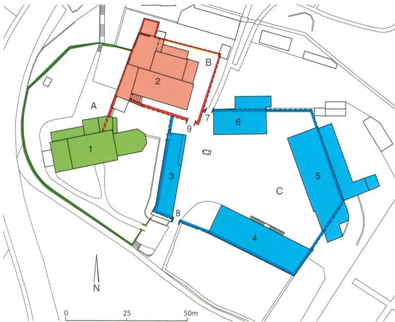
Abb. 1: Köniz, Schloss, Muhlernstrasse 15. Gesamtübersicht des Schlossareals. M. 1:1500. A: Kirche (1) und ummauerter Friedhof. B: ummauertes Kernschloss (2) mit Ritterhaus (1265). C: ummauerter Wirtschaftshof mit spätgotischem Haberhaus (3), Kornhaus von 1725 (4), Pfrundscheune von 1858/1909 (5), Rossstall (6); Rappetöri, 1883 abgebrochen (7); Haberhaustor, 1883 abgebrochen (8); Tor ins Kernschloss, 1788 abgebrochen (9).

Das Schloss Köniz liegt auf geschichtsträchtigem Boden. Auf dem Kirchhügel reichen die ältesten Spuren in Form eines Gräberfeldes ins späte Frühmittelalter zurück. Die Petrus und Paulus geweihte Pfarrkirche wurde gemäss einer Legende von König Rudolf II von Hochburgund (880–937) gestiftet. Der Kern der heutigen Kirche entstand im Hochmittelalter. Es ist jedoch anzunehmen, dass es Vorgänger gab, die bis in karolingische Zeit zurückgehen. Die Pfarrei umfasste im Mittelalter auch das Gelände der nachmaligen Stadtgründung Bern. Die Kirche diente seit dem 12. Jahrhundert auch als Oratorium eines Augustinerchorherrenstifts. 1226 schenkte der deutsche König Dorf und Stift dem Deutschen Orden, der dort eine Kommende einrichtete. Mit der Reformation hob der Staat Bern die Kommende auf und vertrieb die Deutschordensherren, musste den Besitz im Jahr 1554 auf Druck der Tagsatzung aber zurückerstatten. 1729 verkaufte der Orden, der Köniz nur noch als Gutsbetrieb genutzt hatte, das Objekt an den Staat Bern, der darin eine Landvogtei einrichtete.