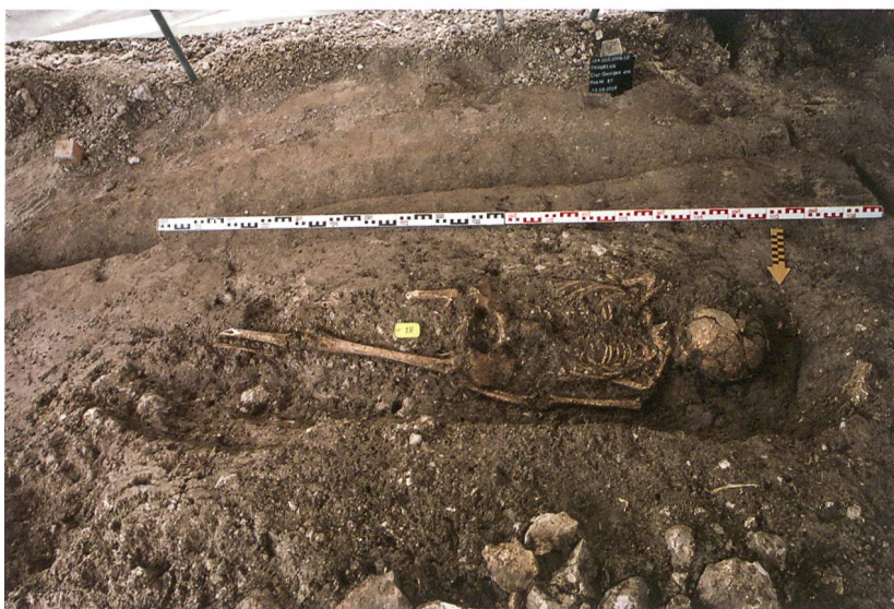
Fig. 4 : Tramelan, Crêt Georges Est. La tombe T38 représente une des sépultures orientées à l'est.

L'implantation des tombes T41 et T42 (fig. 5) semble intervenir au même moment : aucune perturbation n'a pu être identifiée, les squelettes se situent au même niveau et quelques pierres de calage apparaissent à la hauteur de la tête. Les deux inhumations rapprochées T35 et T36 (fig. 3) diffèrent par leur comblement et ne paraissent donc pas contemporaines. Toutefois, elles se respectent, ce qui sous-entend un marquage de surface, sans que l'on puisse déduire une chronologie relative entre elles. La sépulture T37 reposait sur une planche de fond en érable. Par ailleurs, on notera que trois des cinq sépultures nord-sud présentent un positionnement identique des bras : avant-bras gauche sur le bassin et bras droit le long du corps !