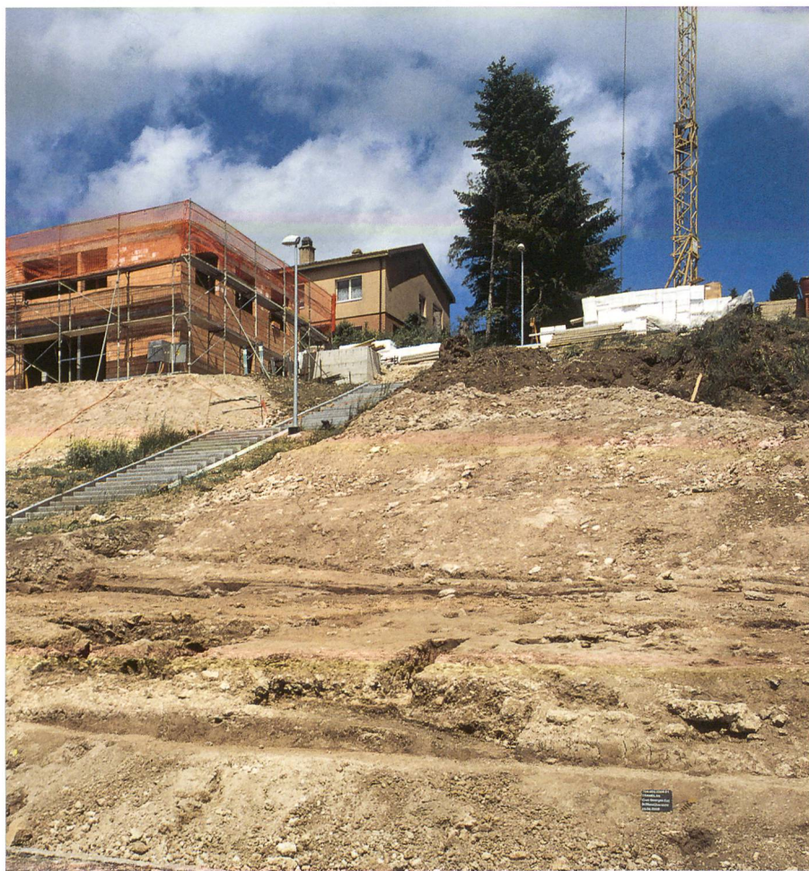
Fig. 1 : Tramelan, Crêt Georges Est. Vue générale du site après l'intervention du mois de juin 2008. On distingue les fosses sépulcrales creusées dans le terrain naturel en pente. Vue vers le nord-ouest.

Sur un coteau appelé le Crêt Georges, à l'entrée est du village de Tramelan, les vestiges d'une petite nécropole rurale du Haut Moyen Age sont apparus lors de creusages en 2006. Deux campagnes de fouilles s'y sont déroulées en 2006 et 2007 et ont fait l'objet d'un premier compte rendu dans ArchBE 2008. Les projets de construction de deux maisons familiales dans ce secteur ont conduit le Service archéologique à de nouvelles interventions en 2008 (fig. 1). Ces deux fouilles ont livré chacune cinq sépultures supplémentaires portant le total des tombes avérées à 40 et celui des squelettes à 41 (une tombe à inhumation double !). A cet ensemble s'ajoutent six structures majoritairement empierrées (T29, T43-T47), qui par leur forme et leur orientation sont à interpréter comme des vestiges funéraires, quoiqu'elles n'aient livré aucun ossement. Ces deux étapes permettent désormais de fixer la limite nord et probablement les extensions est et ouest de la nécropole (fig. 2).