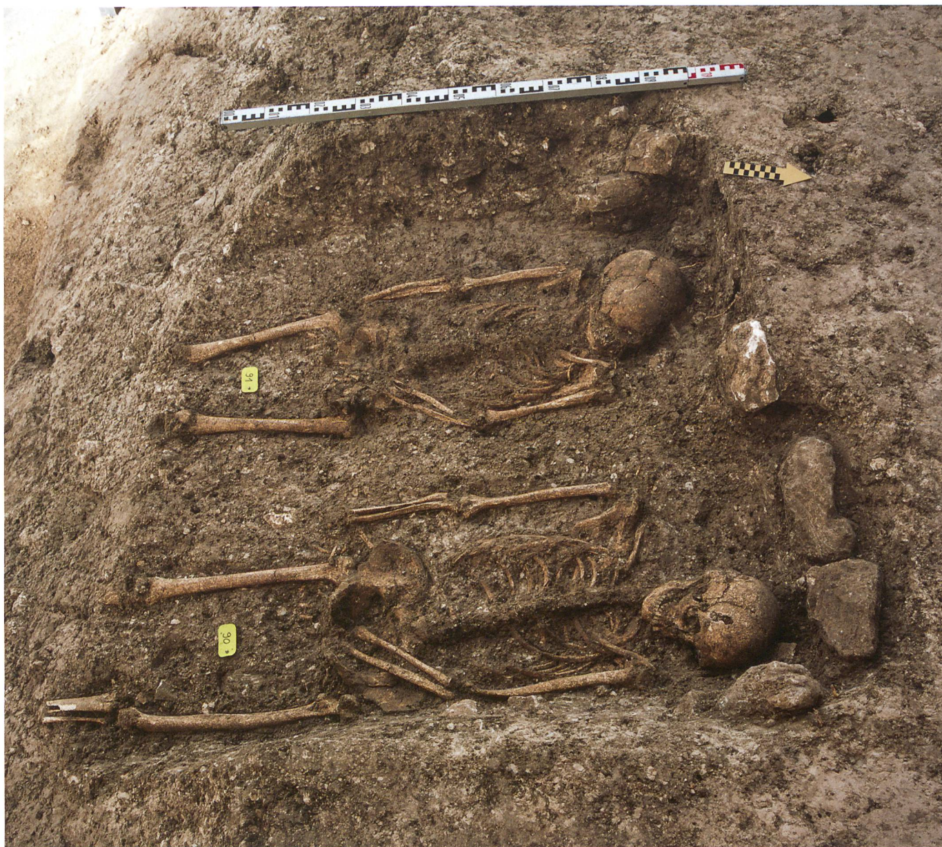
Fig. 5 : Tramelan, Crêt Georges Est : les deux tombes rapprochées T41 et T42 constituent un bel exemple de ces sépultures orientées nord-sud, majoritaires sur le site tramelot.