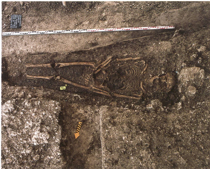
Fig. 3 : Tramelan, Crêt Georges Est. Les tombes orientées à l'est, perpendiculaires à la pente générale, sont minoritaires sur le site : ici la tombe T37.