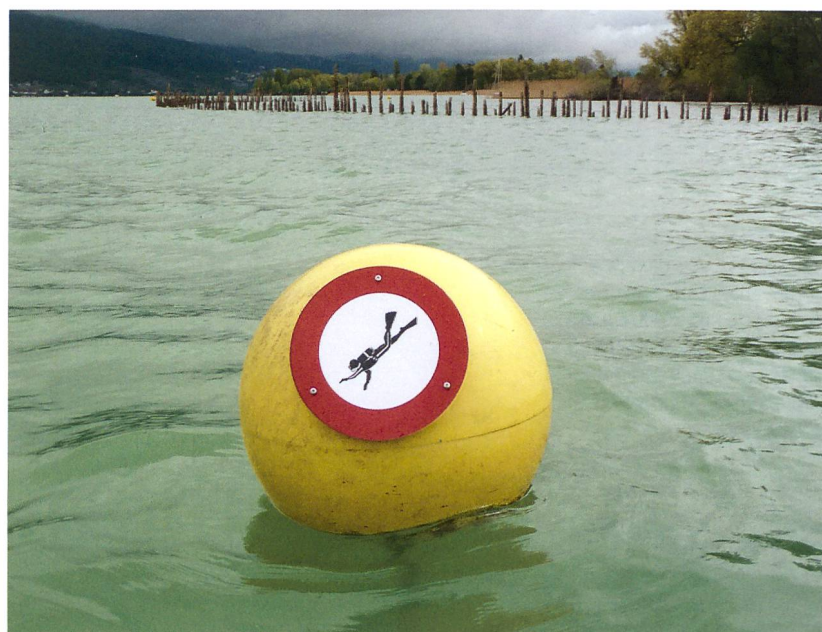
Abb. 3: Sutz-Lattrigen, Rütte. Zum Schutz der archäologischen Fundstelle musste zum ersten Mal in der Schweiz ein Tauchverbot aus denkmalpflegerischen Gründen erlassen werden.

Abb. 2: Sutz-Lattrigen, Rütte. Wind und Wellen erodieren vor allem bei starken Stürmen Teile der archäologischen Fundschichten.