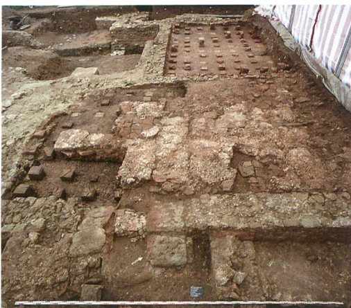
Abb. 6: Kallnach, Hinterfeld, römischer Gutshof. Blick nach Osten über die Anlage. Im Vordergrund die Ostmauer (193) mit dem praefurnium zu Raum 4. Der Feuerkanal wurde sekundär eingebaut und nach Aufgabe des Hypokausts wieder zugemauert. In Raum 4 sind über dem verfüllten Hypokaust nur noch Spuren des eingezogenen Mörtelbodens erhalten.

In Raum 2, dessen Nordmauer dicht hinter der Grabungsgrenze folgen muss, gibt es keine Anzeichen verschiedener Bauphasen. Er könnte natürlich in verschiedenen Phasen der Thermenanlage unterschiedlich genutzt worden sein, als caldarium oder als tepidarium (lauwarmer Raum). Demgegenüber zeigte Raum 4 deutliche Funktionswechsel (Abb. 6). Das an seiner Ostwand erfasste praefurnium (243) wurde sekundär eingebaut. Offen bleibt, ob Raum 4 anfänglich nicht beheizt war, oder ob er ursprünglich von der Nordseite