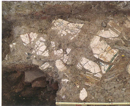
Abb. 7: Kallnach, Hinterfeld, römischer Gutshof. Bemalter Verputz in Fundlage. Er stammt vermutlich von der Decke der porticus (3).

Auf dem untersuchten Areal fanden sich drei gemauerte Kanäle, die das Abwasser aus dem Badetrakt und aus anderen Teilen der Villa abführten (vgl. Abb. 3). Ihre Wände waren teils mit Terrazzomörtel verputzt, die Sohlen mit Hypokaust- oder Dachziegeln belegt. Der grösste Kanal hatte eine lichte Weite von 60 × 100 cm. Kanal (264) führte leicht schräg, dicht ausserhalb von Raum 4 vorbei (Abb. 8) und mündete etwa 10 m südlich der Gebäudefront in den Ost-West verlaufenden Kanal (342). Die Anbauten an der Aussenfront von Mauer (193) sowie die Hofmauern entstanden nach dem Kanalbau. Den Ansatz eines weiteren, nur einige Zentimeter tiefen Kanals (287) haben wir an der Südwestecke von Raum 3 erfasst. Eine dicht an der westlichen Grabungsgrenze in Kanal (342) mündende Rinne (372) dürfte das Endstück von (287) sein. Nebst Dachwasser könnte (287) auch das Abwasser