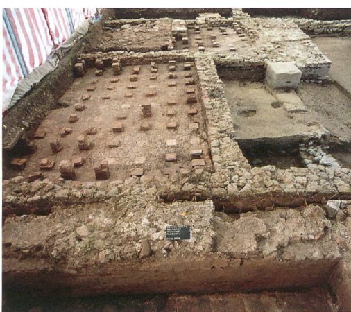
Abb. 5: Kallnach, Hinterfeld, römischer Gutshof. Im Vordergrund Raum 1. Der Unterboden des Hypokausts ist mit Dachziegeln belegt. Rechts die kleine Verbindungsöffnung zur Tubulatur zwischen den Mauern. An der Mauerfront Verputzreste mit Abdrücken von tubuli. Im Mittelgrund das caldarium Raum 2 und die porticus Raum 3 mit einer der beiden Säulenbasen. Im Hintergrund das frigidarium Raum 4 mit vorgebautem Erker. Blick nach Osten.

Das hypokaustierte Warmwasserbecken in Raum 1 ist ein Hinweis auf eine besonders luxuriöse Anlage, stand doch in kleineren Bädern das warme Wasser meist lediglich in einer Wanne zur Verfügung. Eine Besonderheit ist zudem die Hinterlüftung zwischen Gebäudemauern (169), (170) und Beckenmauer (180) durch die abschnittsweise Trennung mit tubuli (Hohlziegel) (Abb. 4). Diese waren durch eine Öffnung im untersten Bereich der Beckenmauer mit dem Hypokaust verbunden. Die Tubulatur an der Innenseite der Beckenmauer war nicht erhalten, liess sich aber anhand von Negativabdrücken im Verputz noch deutlich erkennen (Abb. 5).