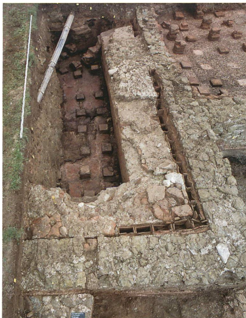
Abb. 4: Kallnach, Hinterfeld, römischer Gutshof. Raum 1 mit Resten der Hypokaustpfeiler, Beckenmauer und – als Trennung zur Gebäudemauer – Partien mit Tubulatur. Im Hintergrund der schräg in den Hypokaust ziehende Heizungskanal. Blick nach Norden.