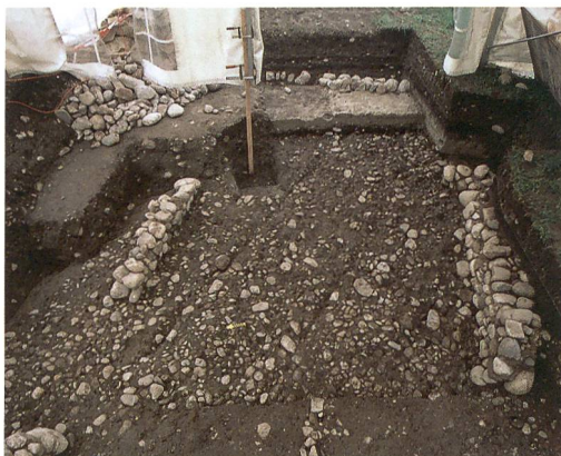
Abb. 4: Hasle bei Burgdorf, Kirchmatte. Die Sockelmäuerchen und die Schotterplanie des grossen Gebäudes.

Wir haben also ein stattliches Gebäude auf quadratischem Grundriss, wahrscheinlich zweigeschossig, das direkt neben dem Kirchhof stand und auf die eine Hauptstrasse von Hasle hin ausgerichtet war. Ausserdem war das Gebäude prominent bzw. sein Bauherr mächtig genug, dass er es auf einen alten Strassenabschnitt setzen konnte, was eine Verlegung dieses Abschnittes zur Folge hatte.