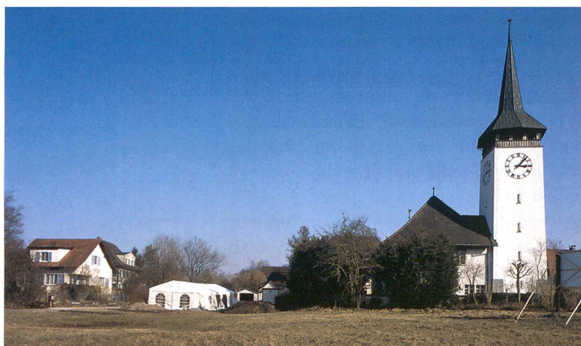
Abb. 1: Hasle bei Burgdorf, Kirchmatte. Übersicht über das Gelände. Rechts die Pfarrkirche, links das Grabungszelt.

Die Pfarrkirche steht im Zentrum des Dorfes, am südlichen Rand des Flusstales. Obwohl archäologische Ausgrabungen bisher fehlen, ist anzunehmen, dass sie eine Eigenkirchengründung des 11. oder 12. Jahrhunderts ist. Offenbar lag das Kirchenareal damals knapp ausserhalb der Hochwasserzone. Unmittelbar nördlich der Kirche muss die Kante der Schwemmebene gelegen haben. Die Kirchmatte nördlich davon lag bereits in der Emme-Aue. In der Grabung war das in Form von Schwemmsand- und Schwemmlehmschichten sichtbar, die den im Schnitt 50 cm unter dem heutigen Terrain anstehende Kiesschotter der Emme überlagerten. Nordwestlich des Grabungsgeländes, im Bereich der künftigen Hausparzellen, fand sich bei den archäologischen Sondierungen ein rund 20 cm starker, torfiger Feuchtbodenhumus, aus dem prähistorische Hölzer geborgen wer-