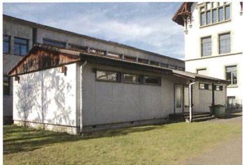
Baracke an der Siedlerstrasse