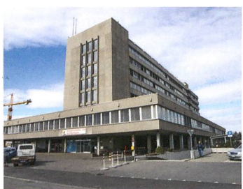
Tiefgarage am Schermenweg