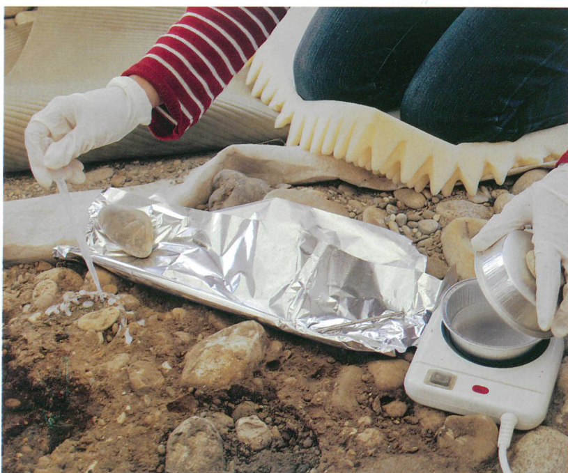
Fig. 1 : Consolidation de surface d'un bracelet en verre, à l'aide de cyclododécane fondu, sur une tombe celtique du site de Basel, Gasfabrik BS.

Les utilisations du cyclododécane en archéologie sont multiples : consolidant lors d'un prélèvement in situ (fig. 1), pour la dépose de peintures murales ou pour le transport, agent de protection temporaire lors d'un nettoyage aqueux, ou encore agent démoulant. Quant à ses modes d'application, ils sont également variés : fondu sur plaque chauffante et coulé, en solution saturée dans un solvant organique ou encore appliqué sous pression, à chaud ou à froid, directement sur le substrat ou sur un média type gaze de coton.