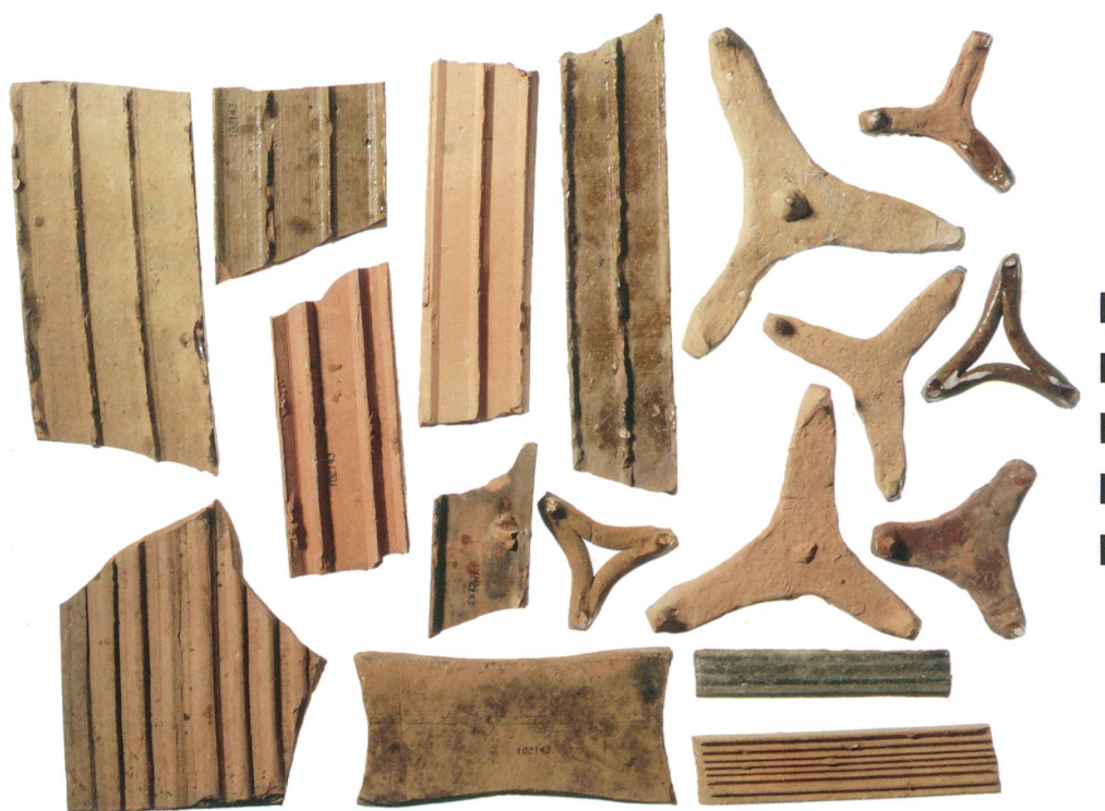
Abb. 6: Steffisburg, Höchhus. Brennhilfen aus der Einfüllung des Töpferofens nach Aufgabe der Töpferei.