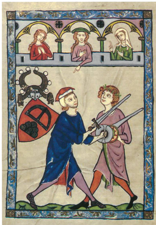
Abb. 2: Minnesänger Johannes von Ringgenberg. Autorenbild in der Manesischen Liederhandschrift, Universitätsbibliothek Heidelberg, fol. 190v.

Die von einer systematischen Planaufnahme und archäologischen Bauuntersuchung begleiteten Konservierungsarbeiten der Jahre 2006 und 2007 erlauben es, die Baugeschichte der Burg etwas differenzierter darzustellen (Abb. 3). Eine Burgenbauphase vor 1230 ist unwahrscheinlich, die Nutzung des Burghügels im Frühmittelalter jedoch durch das von Frutiger dokumentierte Steinkistengrab gesichert. Die für die späte Bronzezeit geltend gemachten Funde sind mittlerweile verschollen.