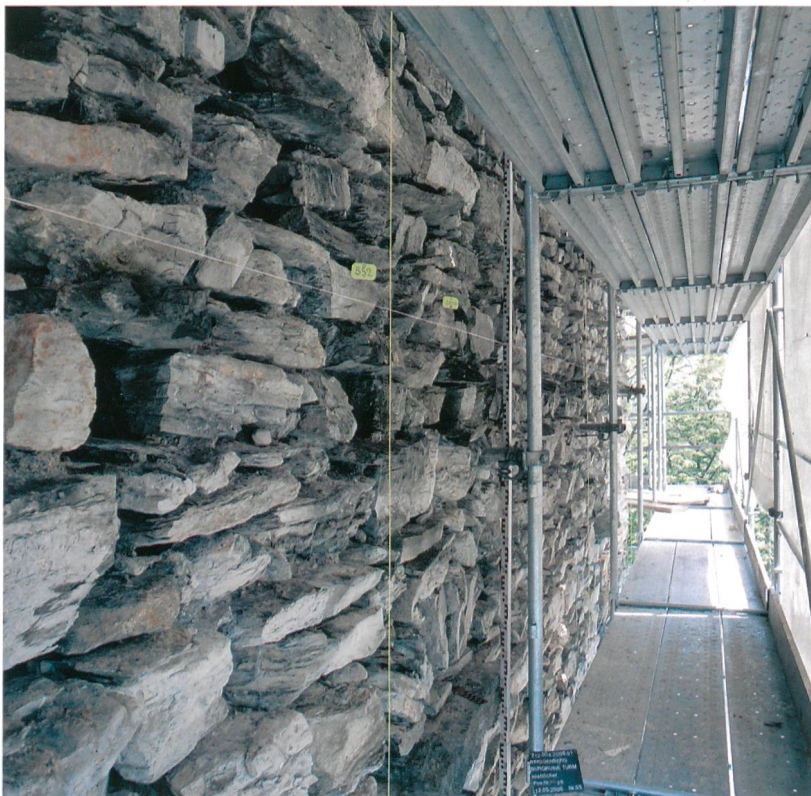
Abb. 4: Ringgenberg, Burg- ruine. Südfassade des Turms mit Brutnischen im noch unverputzten Zustand.

Unter Ausnützung der Ringmauern erfolgte 1670/71 der Einbau der heutigen Kirche. Einzig das östliche Drittel der Südmauer und die Ostmauer der Kirche mussten neu errichtet werden. Der Innenhof wurde nach dem Kirchenbau als Friedhof genutzt und hat deshalb ein 1,50 bis 2 m höheres Bodenniveau als ursprünglich.