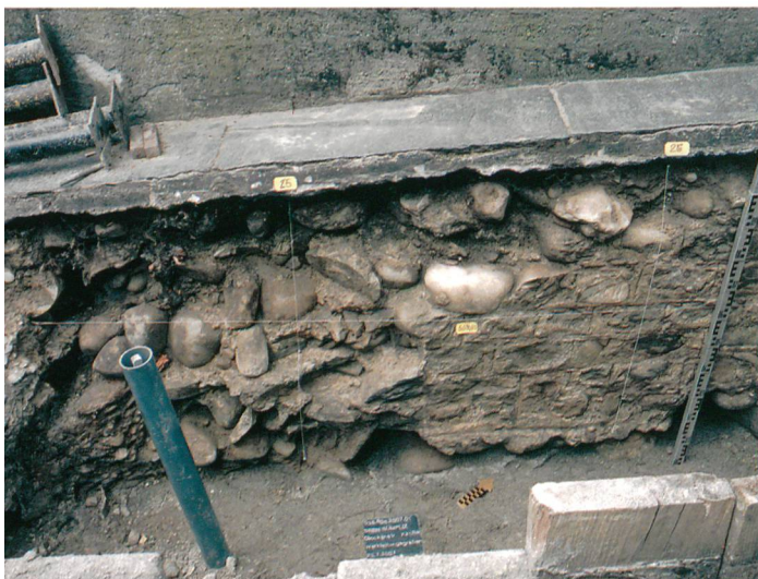
Abb. 1: Bern-Bümpliz, Glockenstrasse / Kirche. Links Ausbruch Mauer 12. Links des Mauerausbruchs von 12 ist der gewachsene Kies 13 sichtbar. Rechts Südfront Mauer 10.

Westlich der Abbruchstelle von Mauer 12 konnte der Westrand des zu Mauer 10 gehörigen Mauergrabens in der anstehenden Kiesbank 13 beobachtet werden. Der Befund zeigt, dass Mauer 10 nicht mehr nach Westen weiterläuft und hier tatsächlich eine Mauerecke vorliegt. Zusammen mit den Aufschlüssen von 1968/69 bestätigen die neuesten Befunde unseren Gesamtplan des römischen Gutshofes insofern, als die nach Süden verlaufende Mauer 12 den Westabschluss des römischen Gutshofes bildet (Abb. 2).