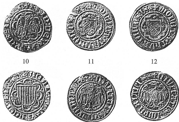
Abb. 2: Burgdorf, Siechenhaus. Fundmünzen, Inhalt einer zerstreuten Börse (?) aus dem zweiten Viertel des 15. Jh.

Fundmünzen ADB, Inv.Nr. 068.0086 Fnr. 38305/4 SFI 404-5.2: 2