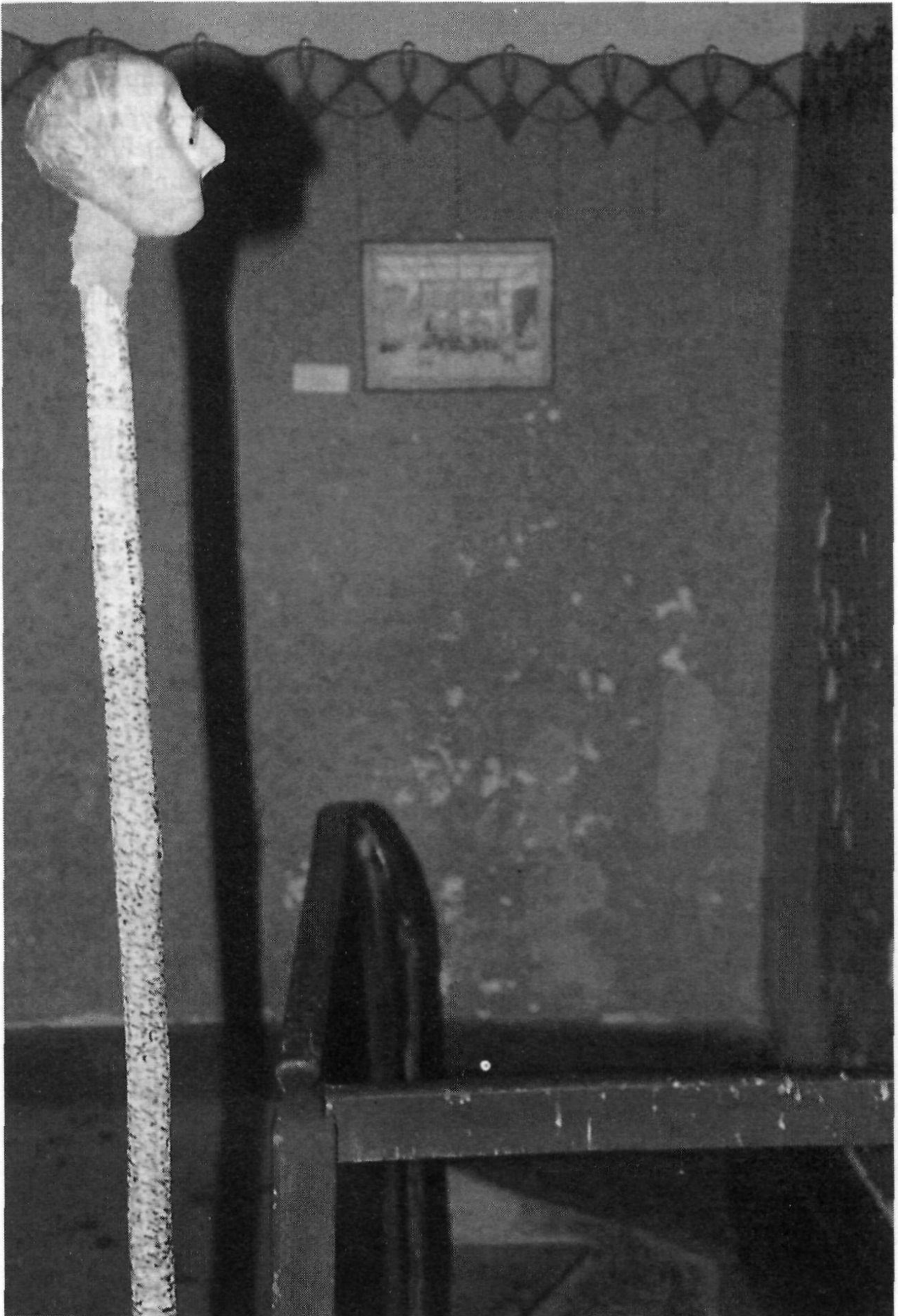
Ausstellung im Kirchturm Heiden.