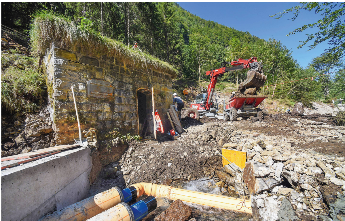
Die Gätteri-Quellen wurden mit grossem Aufwand neu gefasst.

Minute) und sind damit der wichtigste Pfeiler in der Versorgung des Dorfes Appenzell. Die Feuerschaugemeinde investierte rund eine Million Franken in ihr Juwel. Nicht nur die Fassung, auch das Brunnenhaus und die Leitung zur Aufbereitungsanlage wurden erneuert.