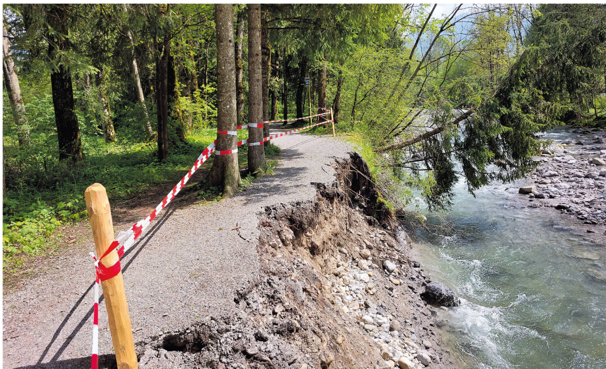
Starkniederschläge richteten erhebliche Flurschäden an.

sich sehr dynamisch. Es wurde im Vergleich zum Vorjahr nur halb so viel Butter importiert. Der Käseexport hingegen brach ein, während Importe von Weichkäse deutlich zunahmen. Nach der Überproduktion von Schweinen im Vorjahr startete der Markt mit einem Preis von nur 3 Franken. Ab Beginn der Grillsaison stieg er an und verharrte bis zum Jahresende bei 3,80 Franken. Auch der Preis für Mastkälber sank im Vergleich zum Vorjahr über alles gerechnet. Im Eiermarkt folgten nach massiver Überproduktion im Jahr 2022 etliche Lieferengpässe, weil die Herden der Legehennen als Sofortmassnahme verkleinert worden waren. Per 1. Januar wurden die Tierbestände erhoben. Die Anzahl Rindvieh blieb konstant bei 14 468 Tieren. Der Schweinebestand sank auf 18 307 (-3016) Tiere, jener des Geflügels auf 147 407 (-24 112) Tiere. Gezählt wurden weiter 822 Ziegen, 2503 Schafe und 182 Pferde. 77 Imkerinnen und Imker betreuten 737 (679) Bienenvölker.