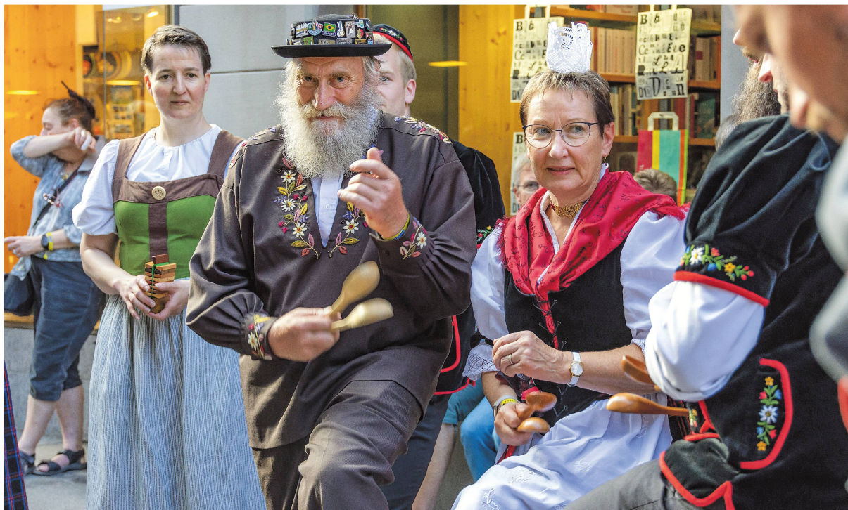
Das Appenzeller Ländlerfest lockte «gschpone vill Lüüt» an.