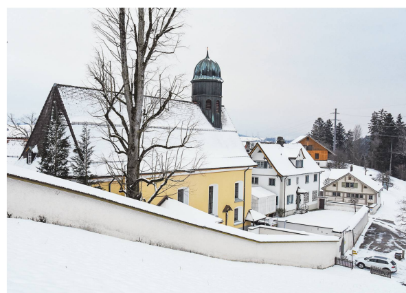
Das neue Schulhaus in Oberegg wurde dem Betrieb übergeben.