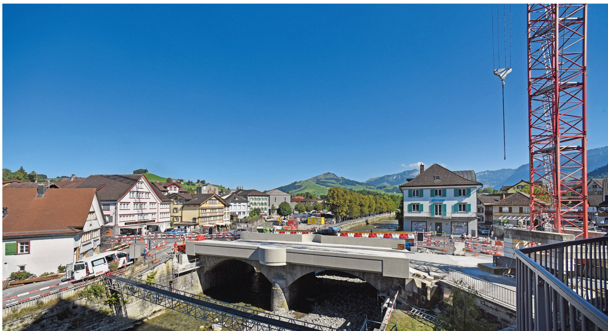
Der Umbau der Metzibrücke unter Verkehr erwies sich als logistische Herausforderung.

Dienste leisten wird. Auch die Digitalisierung des «Appenzeller Volksfreund» – dies im Auftrag und auf Kosten des Kantons – ist angelaufen. Das Roothuus Gonten dokumentierte die regionale Volksmusik mehrdimensional: Als neue digitale Ebene wurde die Sammlungsdatenbank www.volksmusik.ch aufgeschaltet. Einheimischen und Touristen dürfte auch der Führer «Kunstlandschaft Appenzell», der im Mai vorgestellt wurde, gute Dienste leisten. 48 kunsthistorische Schätze und zeitgenössische Kunstobjekte im öffentlichen Raum werden vorgestellt auf einer Landkarte, digital und in einer Web-App.