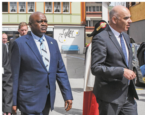
Bundespräsident Alain Berset (rechts) besuchte die Landsgemeinde mit seinem Staatsgast aus Botswana.

der Bedürfnisse der übrigen Kantonsbevölkerung noch Nachhaltigkeit, Ökologie und Klimawandel, wurde gesagt.