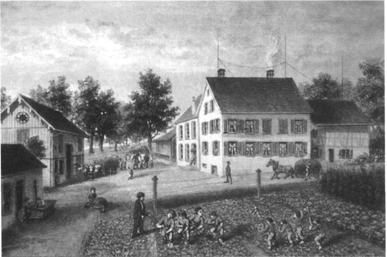
Wehrliknaben bei der Arbeit.

auch getan, wenngleich nicht zur Freude aller seiner Landsleute.