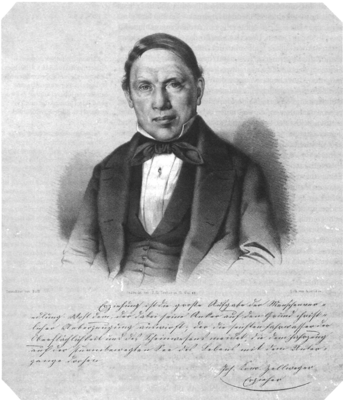
Johann Konrad Zellweger (1801–1883), Tonlithographie.

Erziehung ist die groeste Aufgabe der Menschenver=edlung. Wohl dem, der dabei seine Anker auf den Grund christ=licher Ueberzeugung auswirft; der die seichten Fahrwasser der | Oberflächlichkiet und des Scheinwesens meidet, die dem Fahrzeug | auf der sturmbewegten See des Lebens mit dem Unter=gang drohen.