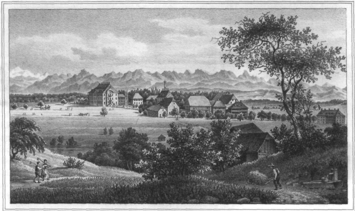
Lith. u. C. Studer.