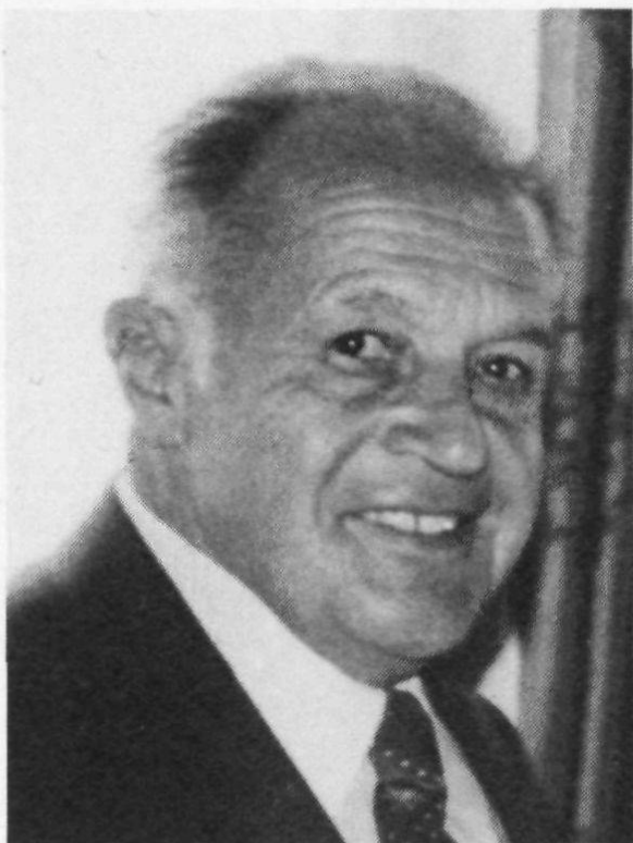
Landeshauptmann Johann Koch, Gonten (1915—1982)