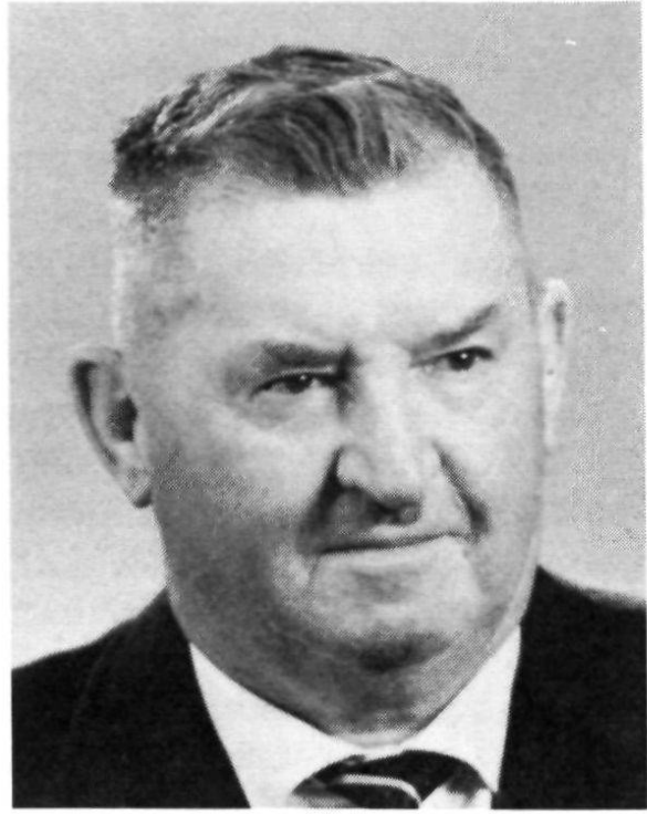
Regierungsrat Jakob Stricker, Stein