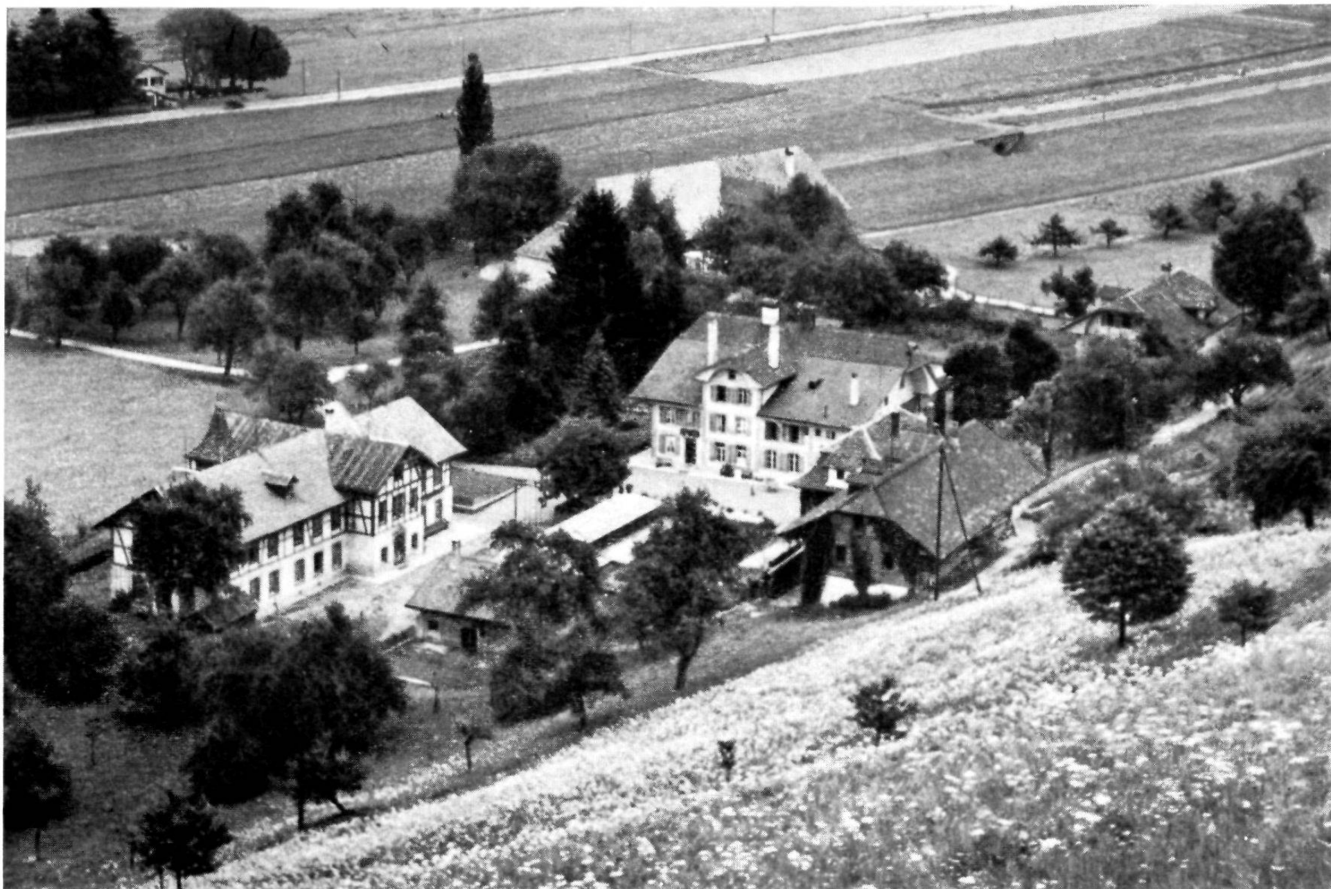
Die Schweiz. Erziehungsanstalt Bächtelen bei Bern