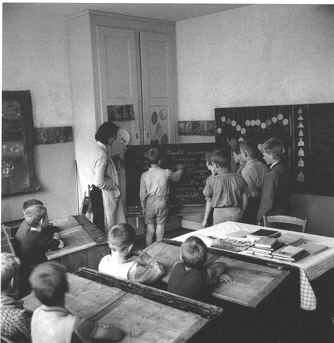
Schulzimmer im Knabenheim «Auf der Grube» in Niederwangen.