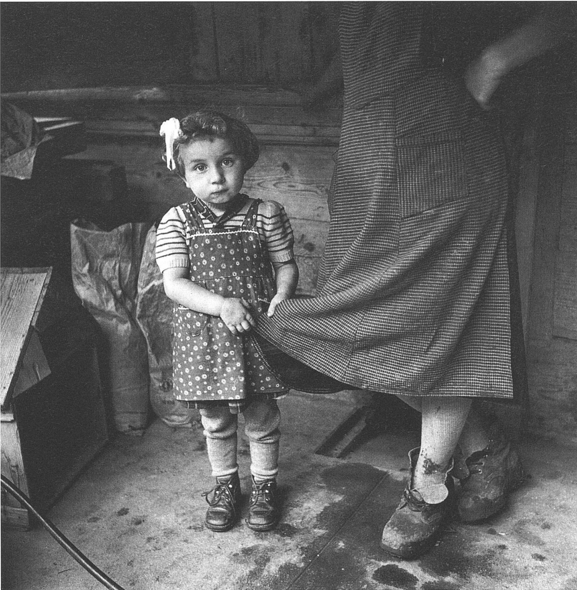
Am Rockzipfel der Pflegemutter. Die Kleider zeigen die ärmlichen sozialen Verhältnisse in dieser (Pflege-)Familie.