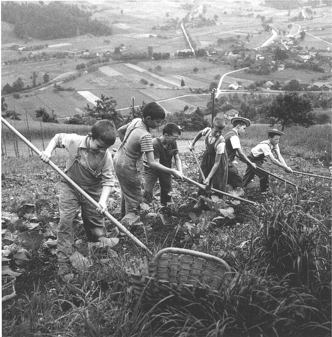
Heimkinder beim Jäten und auf der Heimkehr, Dorneren, Gemeinde Wattenwyl.