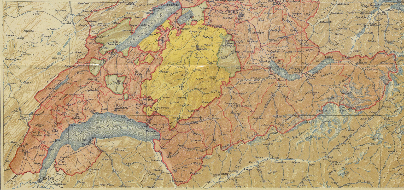
TOPOGR. ANSTALT GEBR. KÜMMERLY & BERN.

Vom Pays de Gex und den Gebieten südlich des Genfersees abgesehen trat Bern ins Jahr 1798 in jener Neid erweckenden imposanten territorialen Grösse, die es im 16. Jahrhundert erreicht hatte.