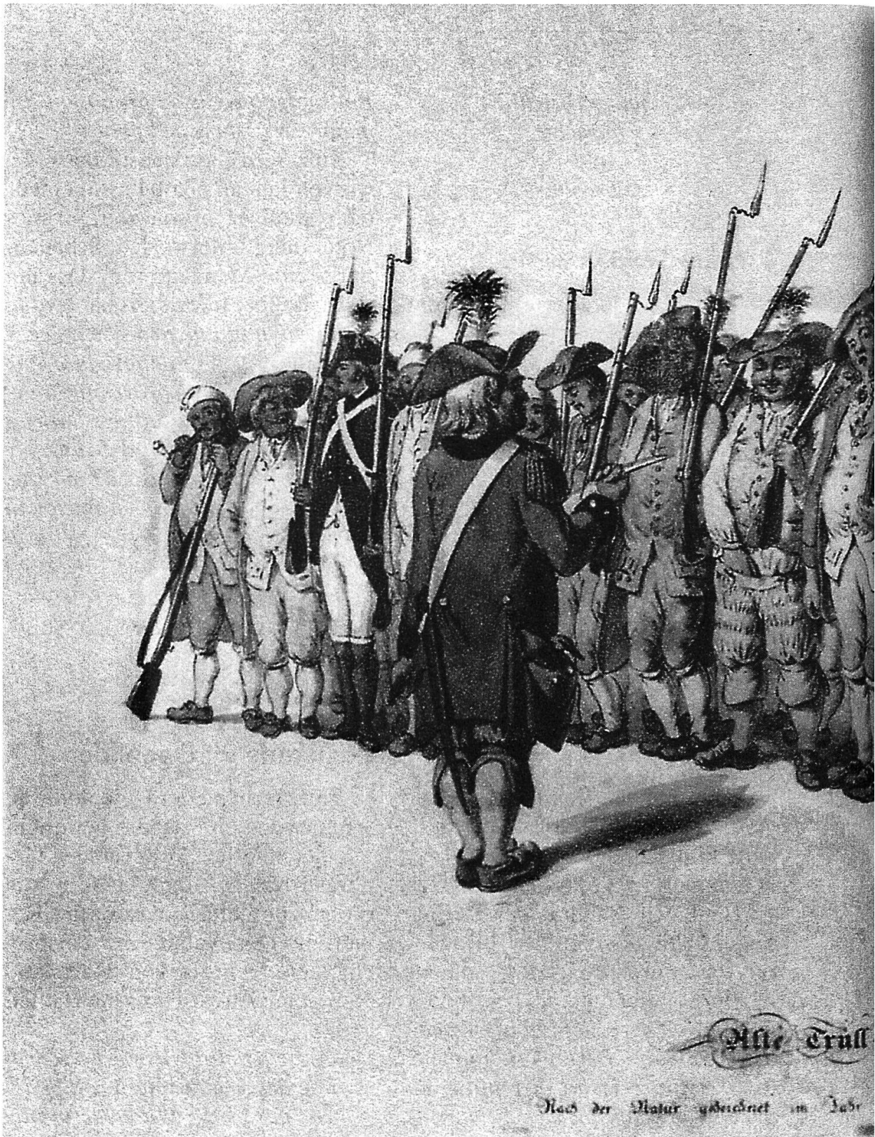
Trüll-Musterung im Jahr 1789. König, Repräsentant des anpassungswilligen Teils der Elite, stellt seine Kunst deutlich in den Dienst seiner Idee, dass nämlich Widerstand gegen die sieggewohnten Franzosen keinen Sinn habe. Es fällt schwer, beim Betrachten nicht an Napoléon zu denken, der im Rückblick grosszügig und wahr