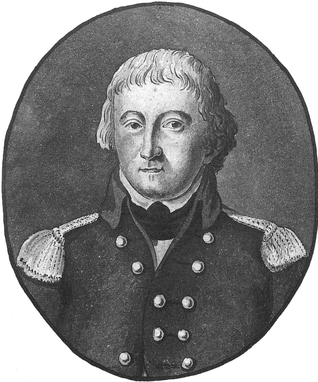
Carl Ludwig von Erlach (1746–1798). Maréchal de camp in französischen Diensten. 1798 tapferer und treuer Oberbefehlshaber der bernischen Armee. Am 5. März 1798 von aufgebrachten Landstürmern zu Wichtrach ermordet, in der Tat ein Opfer verwirrter Zeit. Aus dem Buch «800 Jahre Berner von Erlach» von Hans Ulrich von Erlach, Benteli Verlag, Bern, 1989.