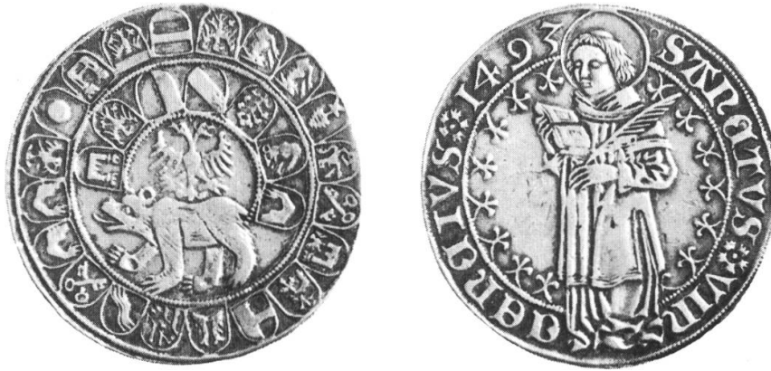
Abb. 1: Berner Silbertaler von 1493.

Vorderseite: Bär mit Doppeladler, eingerahmt von einem halben und einem ganzen Wappenkreis mit den Ämterwappen.