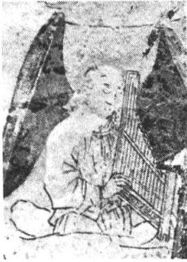
PORTATIV oder Tragorgel

Von einem Wandbild der Westwand in der Kirche Zweisimmen (in nachreforma- torischer Zeit nicht nachweisbar)