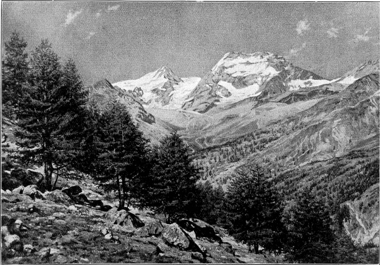
Blick nach dem Fletschhorn und Laquin.